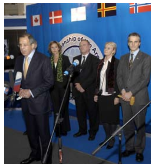
Sitzung des Arktischen Rates am 26. Oktober 2006 in Salekhard (Russland)

Das Interesse für die Nordgebiete als Arena der internationalen Zusammenarbeit wächst. Dies ist nicht zuletzt auf die Entwicklung in Bereichen wie Energie und Umwelt zurückzuführen.