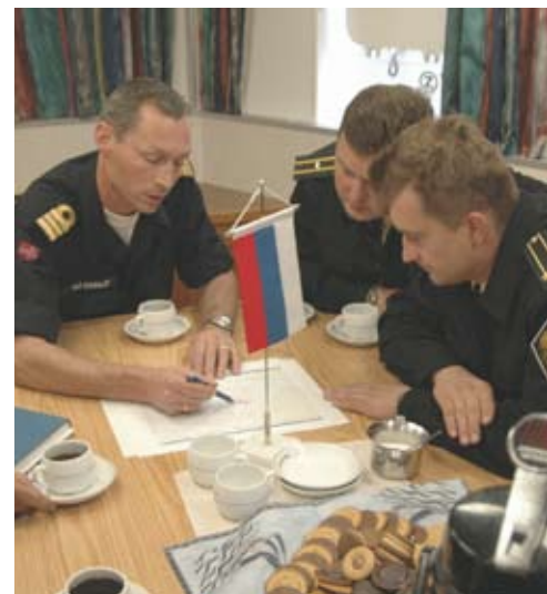
Подведение итогов учения «Баренц Рескью 2006» на борту норвежского корабля береговой охраны «Анденес» с участием представителей Норвежской и Российской береговой охраны

Отличительной чертой норвежского управления ресурсами является сочетание активного государственного регулирования с неукоснительным соблюдением законности и международным сотрудничеством. Современное международное право предоставляет широкий выбор средств воздействия, которые Норвегия может использовать в своей работе по управлению ресурсами, которое основывается на знаниях и ориентируется на достижение результатов. В противоположность развитию в ряде других морских регионов, сочетание эффективного регулирования со стороны Норвегии как прибрежного государства и широкого сотрудничества с другими прибрежными и прочими государствами, чьи интересы затронуты, привело к восстановлению таких важных и в то же время подверженных риску рыбных популяций, как треска и сельдь.