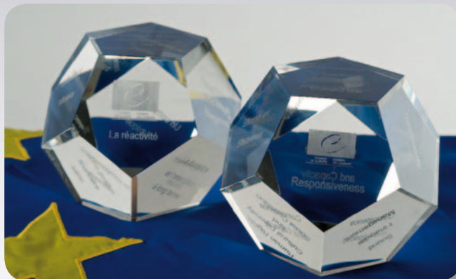
En dodekahedron i krystall med de tolv prinsippene inngravert vil bli gitt til kommunene som får den europeiske utmerkelsen.