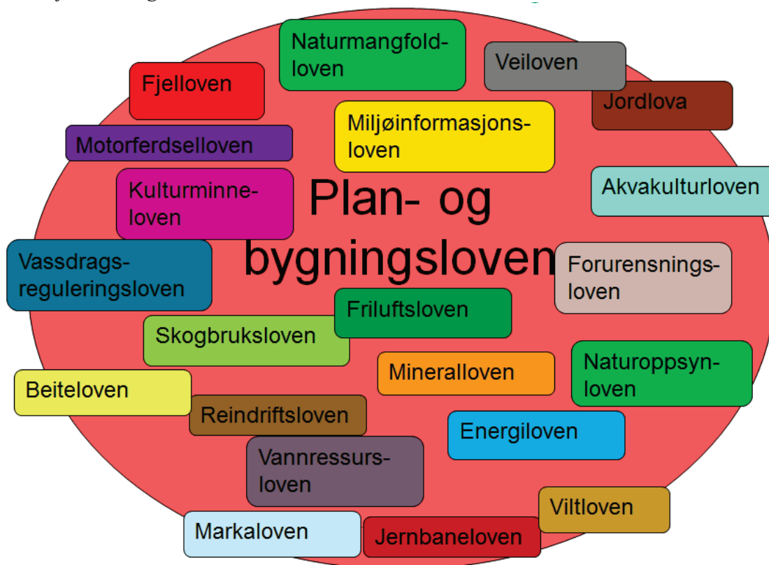
Figur 1: I tillegg til plan- og bygningsloven har en rekke lover betydning for utmarksforvaltningen. Listen er ikke uttømmende.

Planlegging etter plan- og bygningsloven er ment som en felles arena for avveining av ulike interesser knyttet til arealbruk. Det er flere forhold som begrenser planleggingens rolle som styringsmiddel i utmarksforvaltningen. Mens enkelte sektorlover er fullt ut integrert i plansystemet, slik som veiloven, gjelder andre forvaltningssystemer parallelt med, eller ved siden av, plansystemet, f.eks. energisektoren. I tillegg vil forslag om nye tiltak kunne endre forutsetningene i vedtatte planer. Gjennom dispensasjoner eller omregulering kan kommunene godkjenne tiltak i strid med arealformålet i eksisterende planer. Planer kan dermed bli oppfattet og praktisert som et utgangspunkt for, snarere enn et resultat av, forhandlinger.