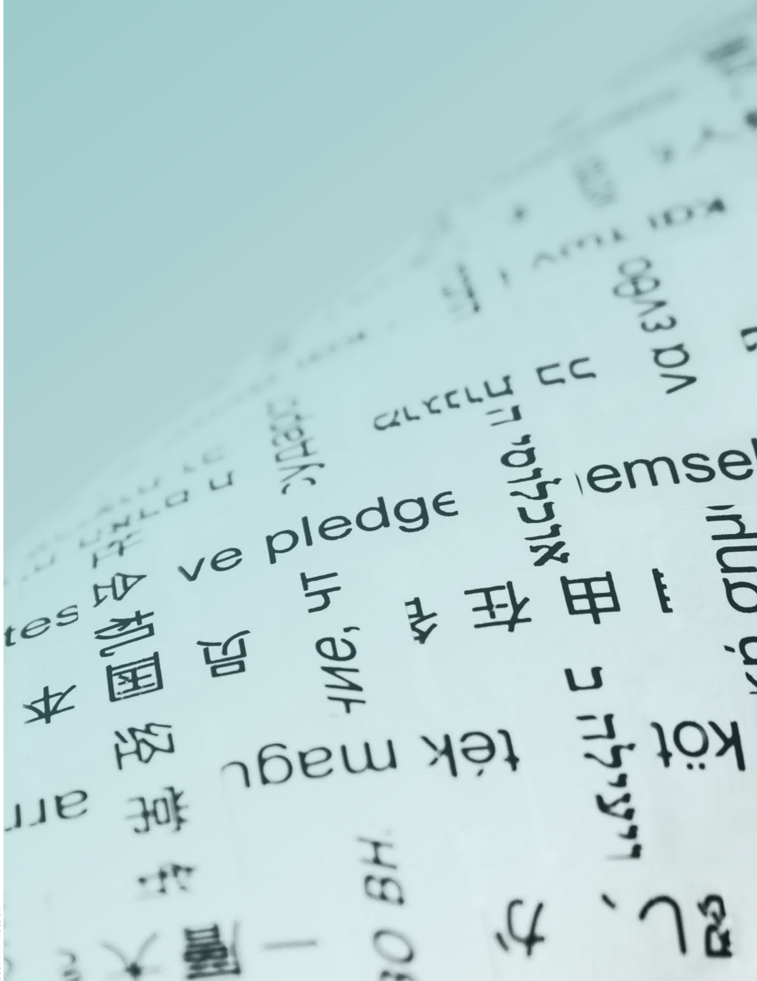
London, 11. februar 2014: Tekst fra FNs verdenserklæring om menneske- rettigheter av 1948 på ulike språk.