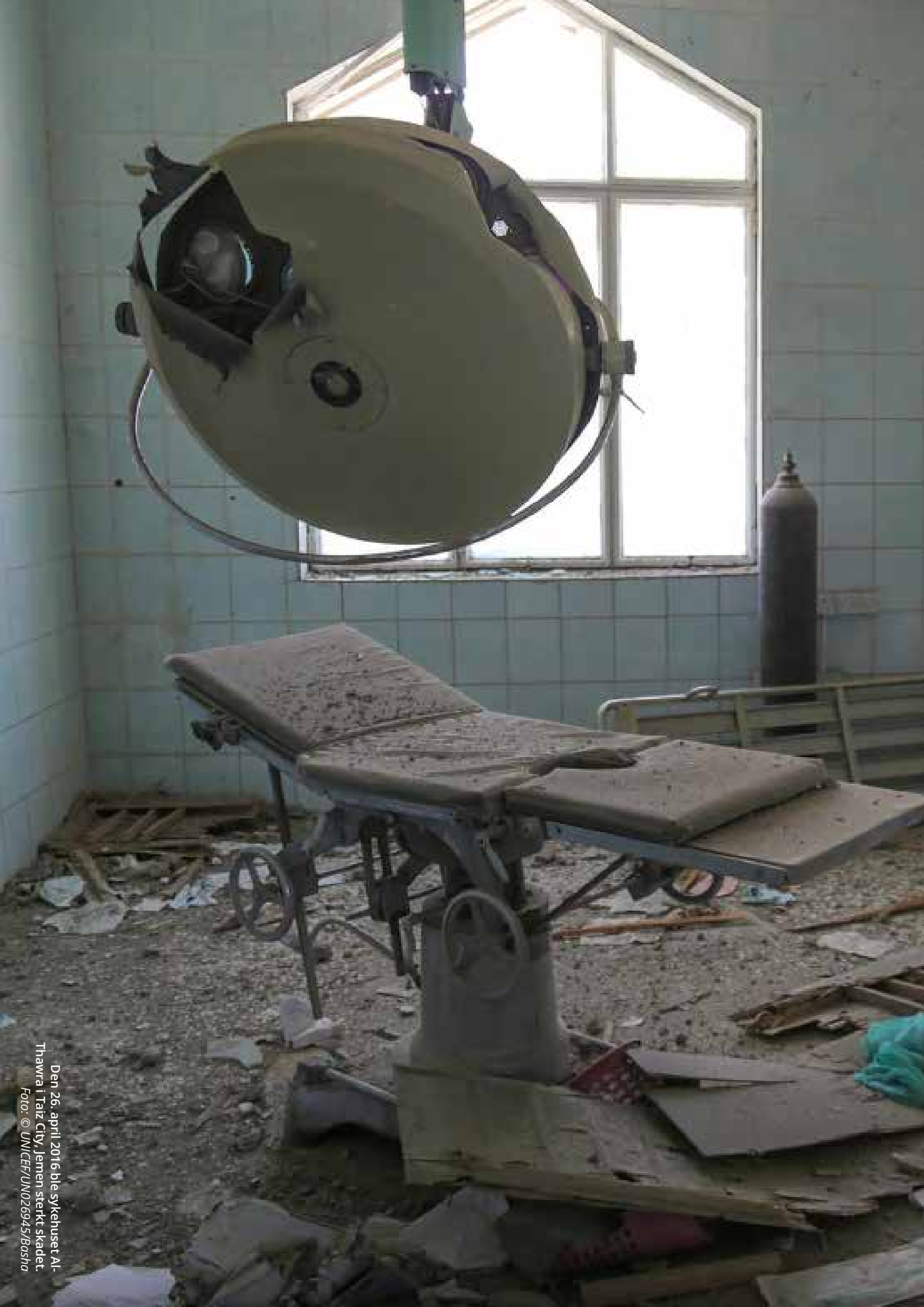
Den 26. april 2016 ble sykehuset Al-Thawra i Taiz City, Jemen sterkt skadet.