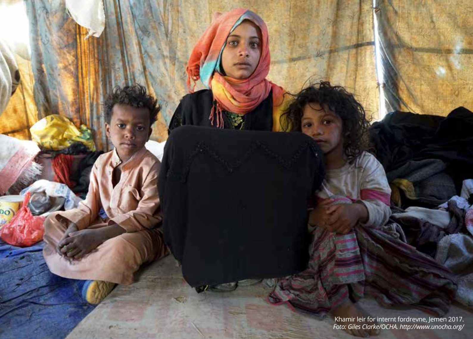
Khamir leir for internt fordrevne, Jemen 2017.