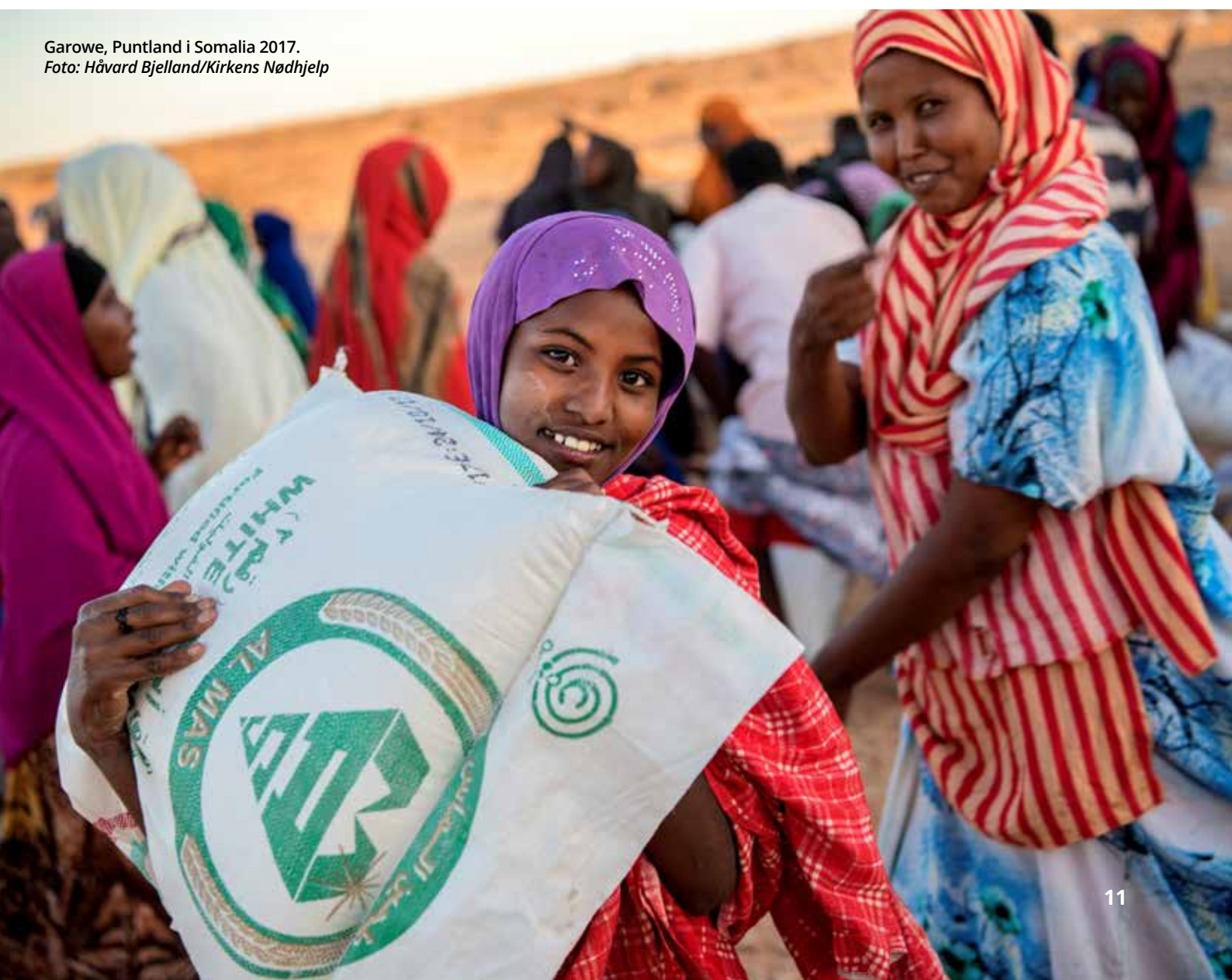
Garowe, Puntland i Somalia 2017.

Nye aktører bidrar til global humanitær finansiering og respons. Privat sektor har fått en viktigere rolle. Bruk av kontanter og digital innovasjon redder liv og skaper nye muligheter, gir økt effektivitet og bedre resultater. Dette krever samtidig ny kompetanse, utfordrer eksisterende koordineringsmekanismer og gjør det nødvendig å jobbe på nye måter.