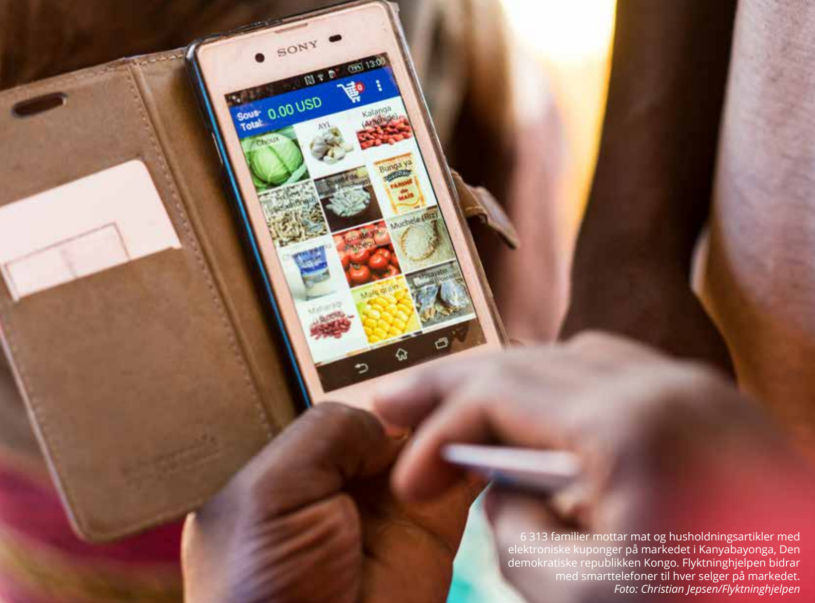
6 313 familier mottar mat og husholdningsartikler med elektroniske kuponger på markedet i Kanyabayonga, Den demokratiske republikken Kongo. Flyktninghjelpen bidrar med smarttelefoner til hver selger på markedet.