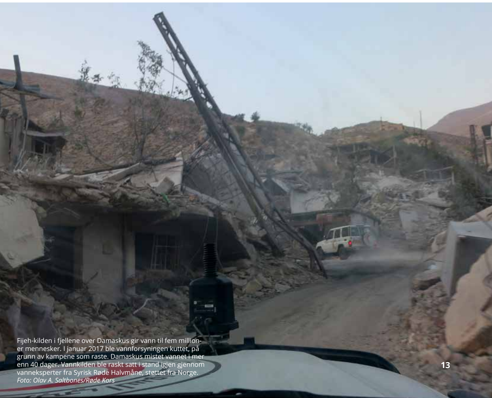
Fijeh-kilden i fjellene over Damaskus gir vann til fem millioner mennesker. I januar 2017 ble vannforsyningen kuttet, på grunn av kampene som raste. Damaskus mistet vannet i mer enn 40 dager. Vannkilden ble raskt satt i stand igjen gjennom vannekspertene fra Syrisk Røde Halvmåne, støttet fra Norge.

De store forskjellene mellom krisesituasjoner krever med andre ord ulike typer innsats og ekspertise. Uavhengig av hvilke tiltak som iverksettes, skal disse imidlertid alltid baseres på behov, i tråd med målet om å redde liv, lindre nød og ivareta menneskers verdighet. God kontekstforståelse, humanitær handlekraft og etterlevelse av de humanitære prinsippene er avgjørende for å nå dette målet.