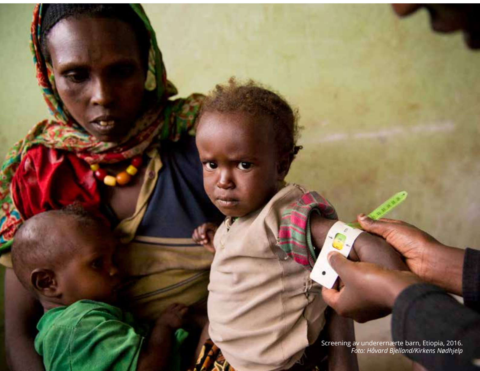
Screening av underernærte barn, Etiopia, 2016.

815 millioner mennesker har usikker eller begrenset tilgang til mat som følge av konflikt og klimaendringer. 17 FNs medlemsland har vedtatt at sult skal være utryddet innen 2030. Matassistanse utgjør en betydelig andel av norsk humanitær bistand. Mye av denne støtten kanaliseres gjennom Verdens matvareprogram (WFP). WFP bidrar for eksempel til at 18,3 millioner barn får skolemat. Som del av den humanitære innsatsen for å redusere sårbarhet gir Norge også støtte til kriserammede mennesker for å sette dem i stand til å brødfø seg selv. De fleste sultkriser er varslede katastrofer, og mye kan derfor gjøres gjennom forebygging og tidlige tiltak. Samtidig gir Norge langsiktig bistand for å utvikle større robusthet mot svingninger i matproduksjonen. Dette skjer både bilateralt og gjennom multilaterale organisasjoner som FNs organisasjon for ernæring og landbruk (FAO) og det internasjonale fondet for jordbruksutvikling (IFAD). Regjeringens handlingsplan for bærekraftige matsystemer i norsk utenriks- og utviklingspolitikk 18 vil ha som målsetting å koble ernæring, matsikkerhet og klimatilpasset landbruk med de fem tematiske satsingsområdene i norsk bistand: utdanning, helse, næringsutvikling og jobbskaping, klima, fornybar energi og miljø, og humanitær bistand.