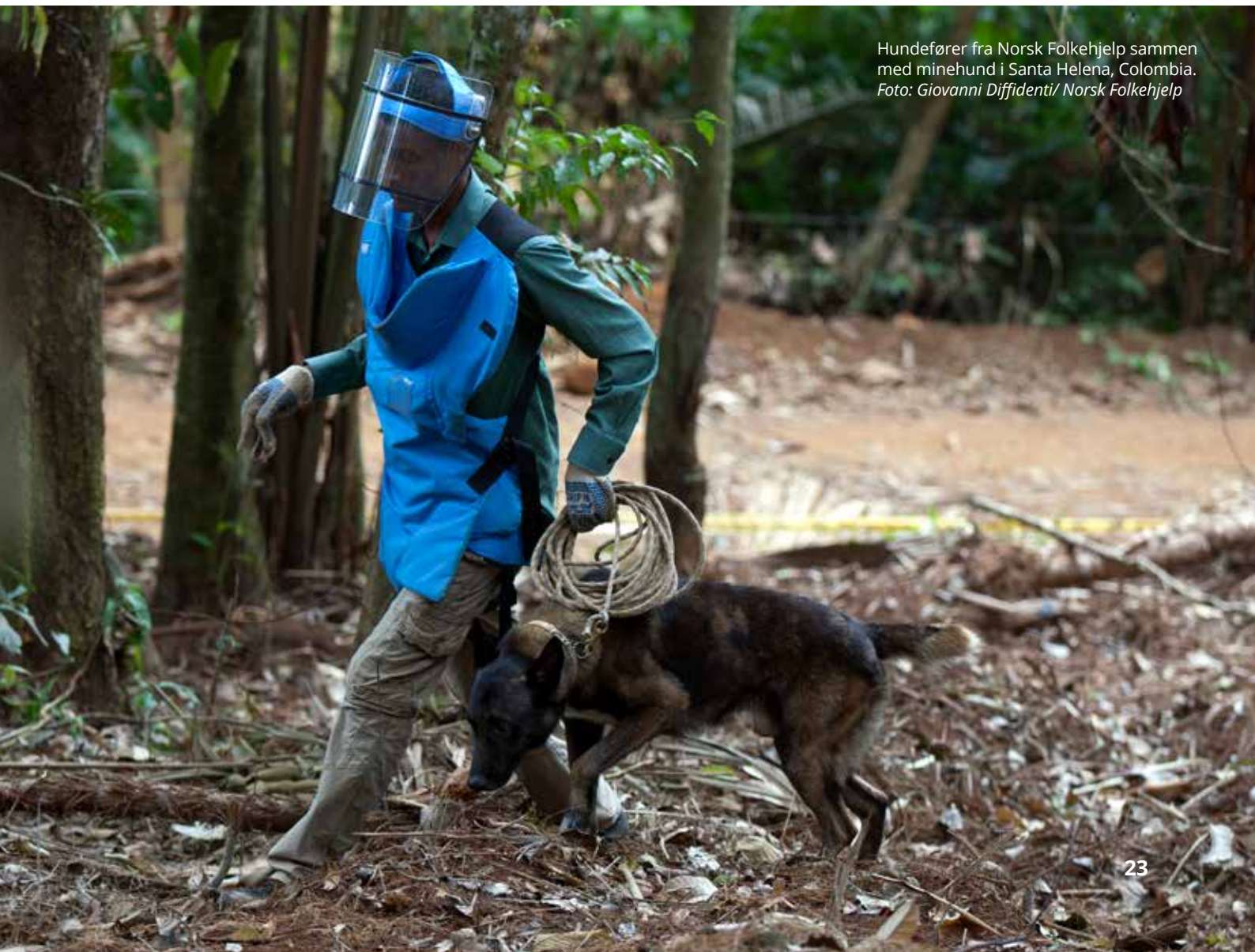
Hundefører fra Norsk Folkehjelp sammen med minehund i Santa Helena, Colombia.