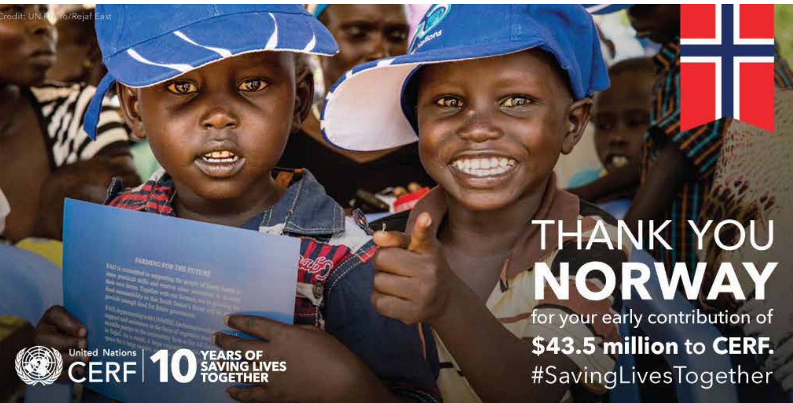
Mars, 2016