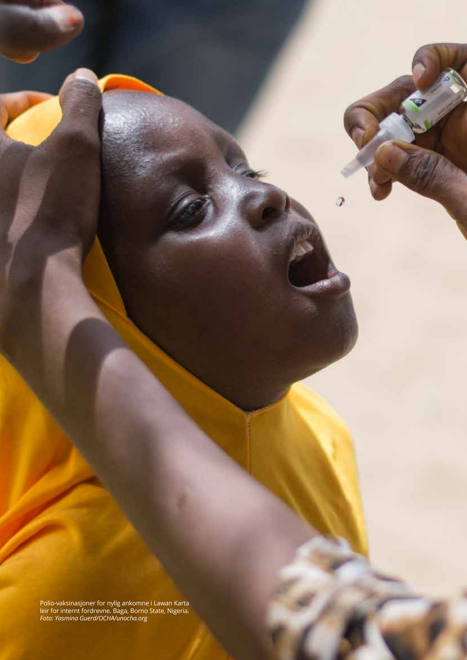
Polio-vaksinasjoner for nylig ankomne i Lawan Karta leir for internt fordrevne. Baga, Borno State, Nigeria.