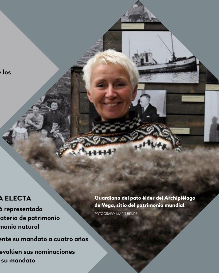
Guardiana del pato éider del Archipiélago de Vega, sitio del patrimonio mundial.