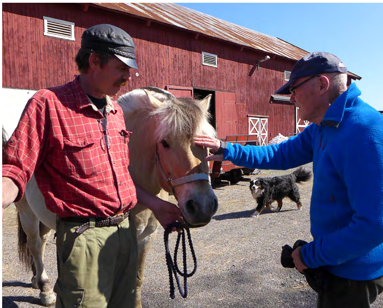
Inn på tunet, Foto Bente Wallander Demens og Alderspsykiatri

Kommunens vurdering av om tiltaket er i tråd med LNFR-formålet er ikke et enkeltvedtak etter forvaltningsloven. Derfor kan ikke denne avgjørelsen påklages til overordnet myndighet.