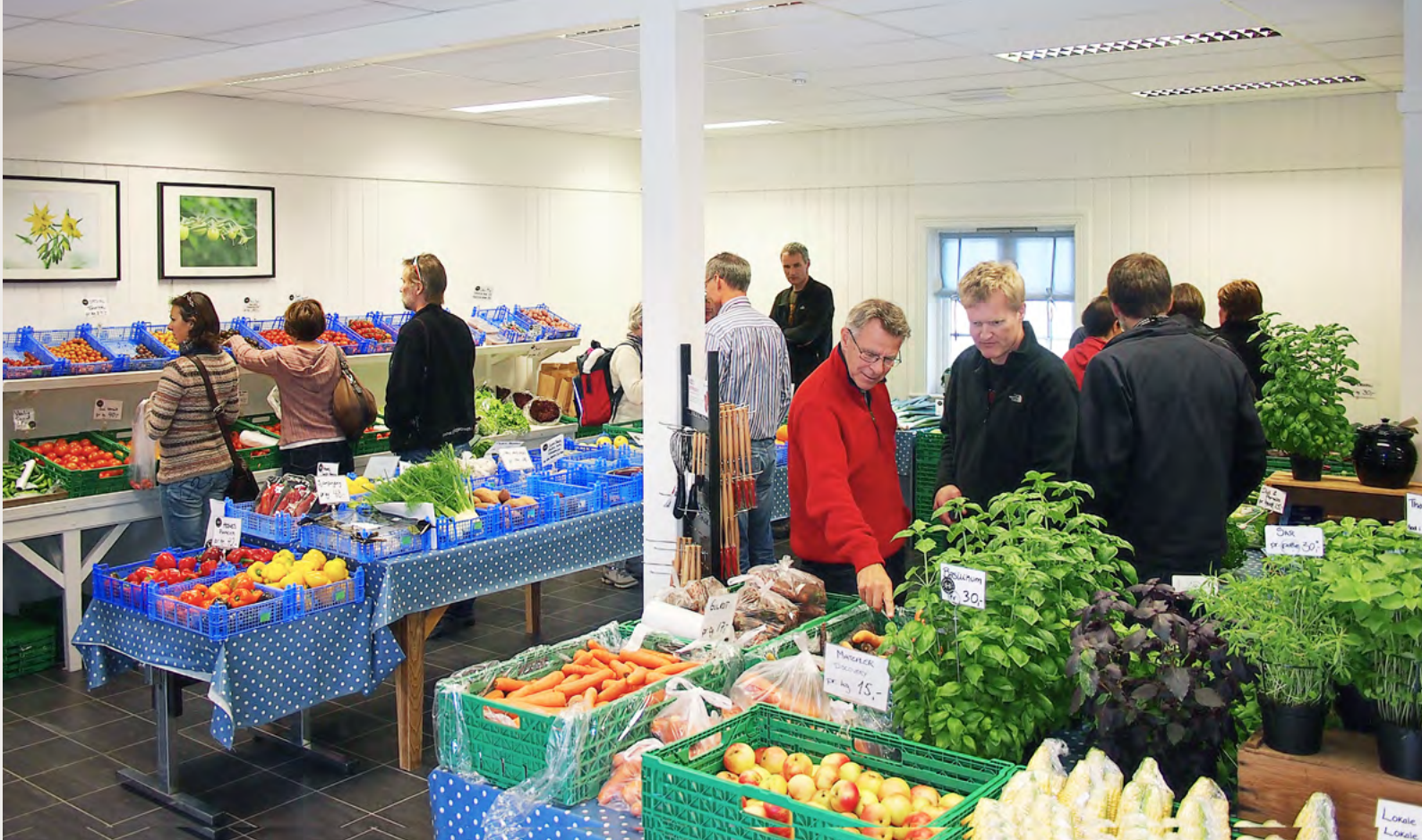
Gårdsutsalg - gartneri