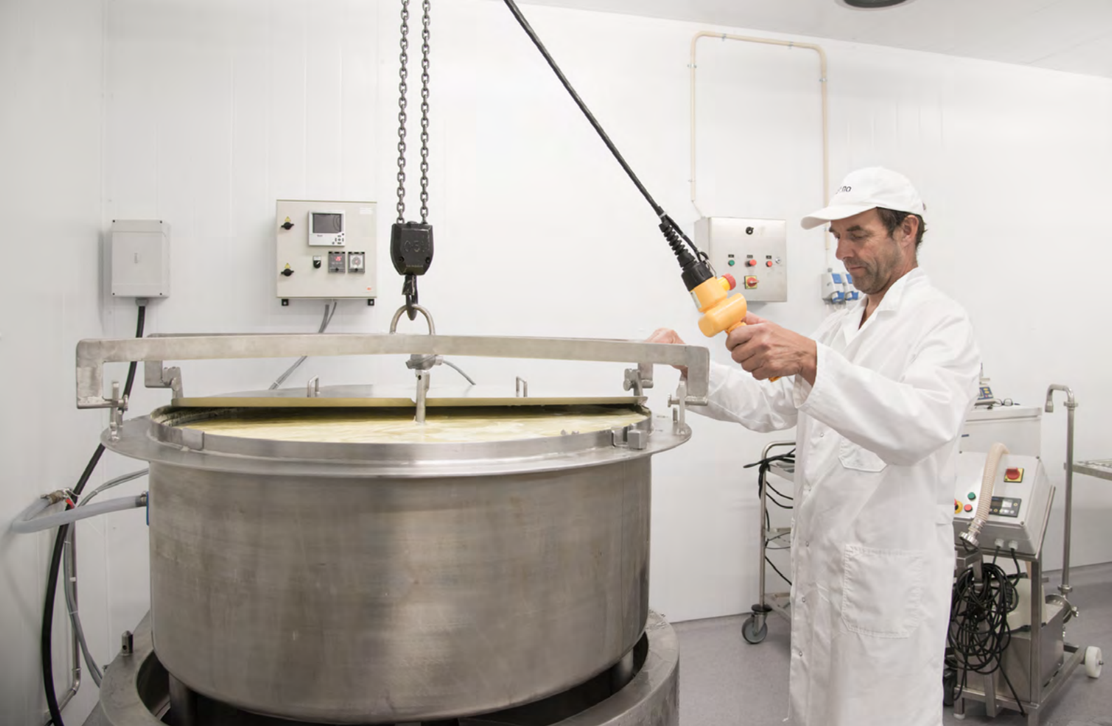
Grøndalen Gårdsmeieri