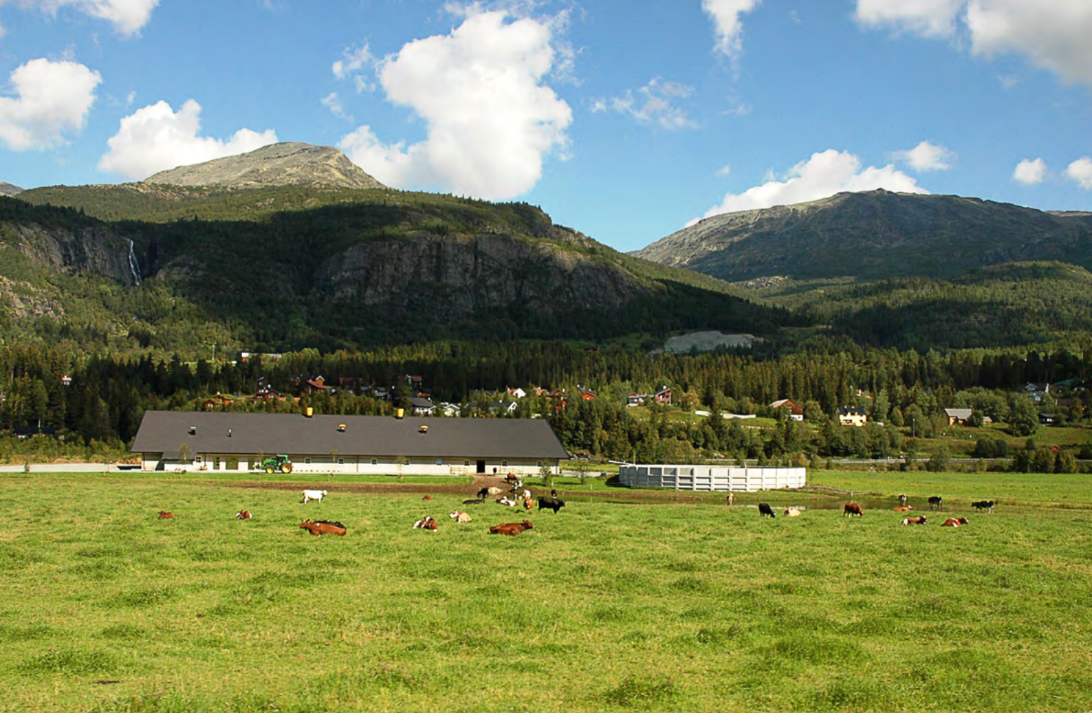
Fellesfjøs Hemsedal