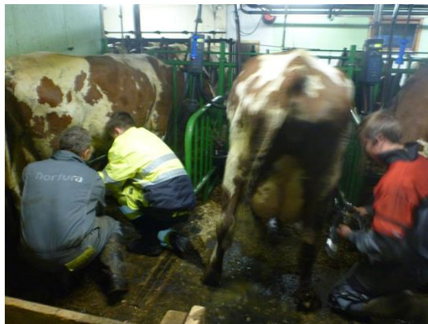
Introduksjon til mjølking, avløserkurs for ungdom 2013