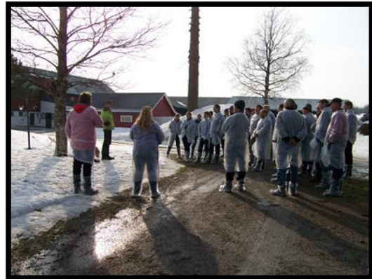
Fagtur om landbruksbygg 2015

"Prosjektet skal synliggjøre landbrukets betydning, skape vekst og kunnskapsutvikling og fremme utvikling og nyrekruttering på driftsenhetene."