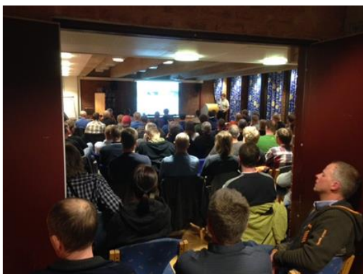
Fra fagdag om landbruksbygg 2014

Merknad: I 2015 var det planlagt PC-kurs i grunnleggende ferdigheter på samme vis som i 2013 og 2014. Bare en deltaker meldte seg og kurset ble avlyst. Dette er et signal om at opplæringsmålet i grunnleggende dataferdigheter ble nådd foregående år, innen målgruppen vi kunne nå.