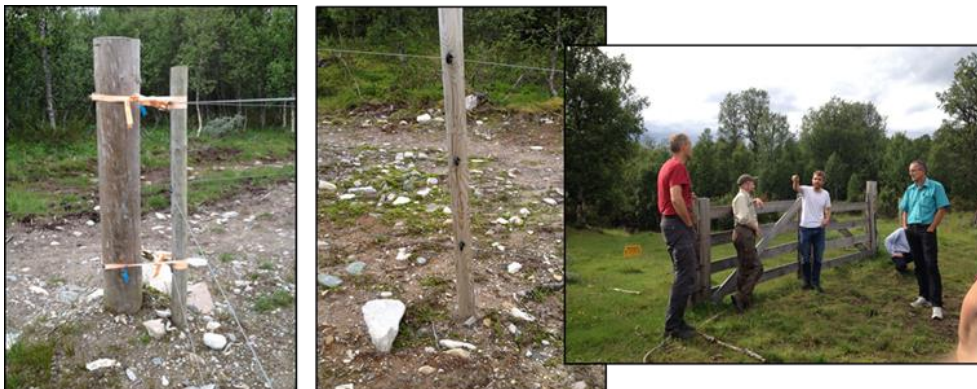
Fra fagtur om utmarksbeitebruk, Østerdalen, 2014

Under punkt 8 i rapporten vil det beskrives nærmere hvordan det er jobbet for å oppnå målsettinger og hvordan måltallene er oppnådd.