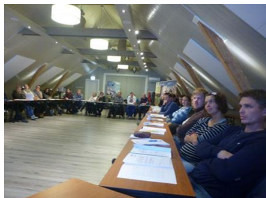
Fra odelstreff i 2013