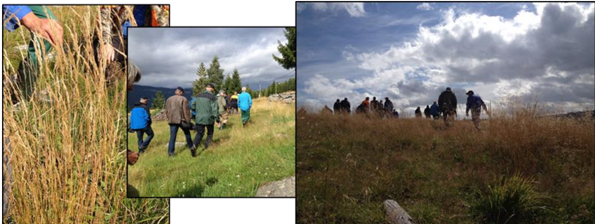
Fra markdag om innmarksbeite 2014

Kommunens egeninnsats i prosjektet består av innsats fra ansatte på Landbrukskontoret for Lillehammer-regionen, RULL-midler fra Oppland Fylkeskommune, egenandel fra deltagere på arrangementer i prosjektets regi og innsats fra prosjektleder utover stillingsprosent i prosjektet. To fakturaer som gjelder prosjektet er betalt over landbrukskontorets driftsregnskap nå i 2016 og er derfor ført som egeninnsats.