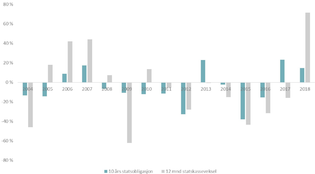
Figur 2: Endring fra år til år for 10 års statsobligasjon og 12 måneders statskasseveksel (årgjennomsnitt)