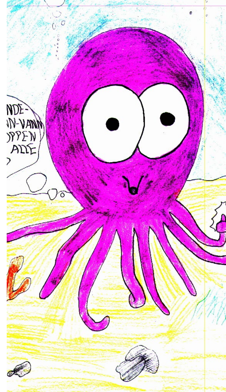
Blekkulf Nicholas 6 kl Selvik