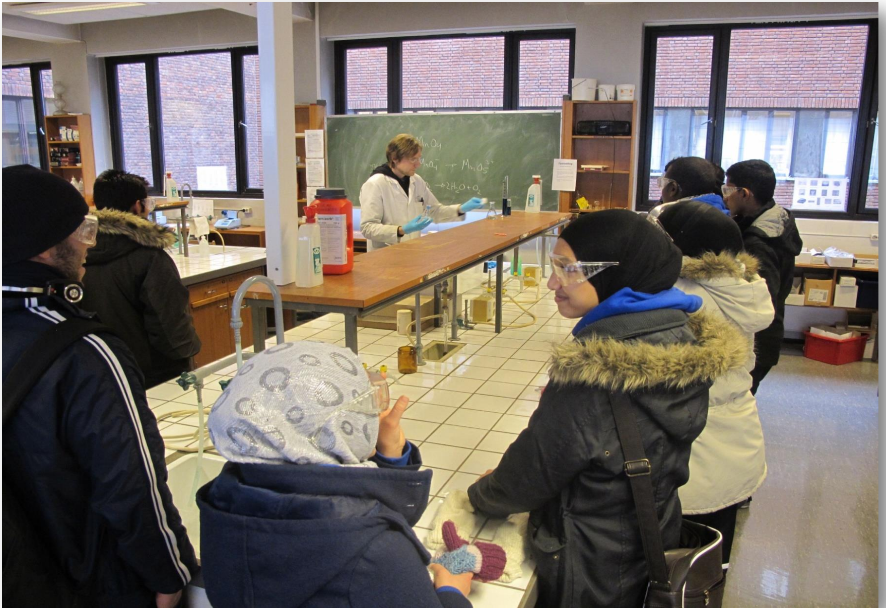
Furuset IF / Alnaskolen 02.03.17