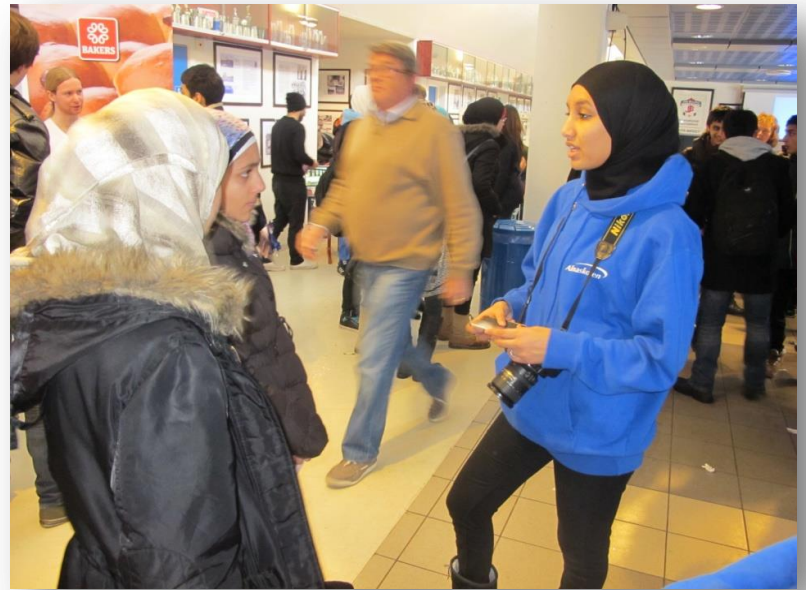
Furuset IF / Alnaskolen 02.03.17