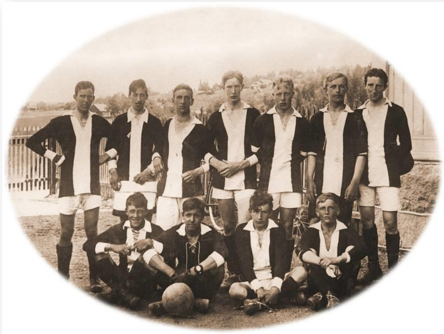
Furuset IF / Alnaskolen 02.03.17