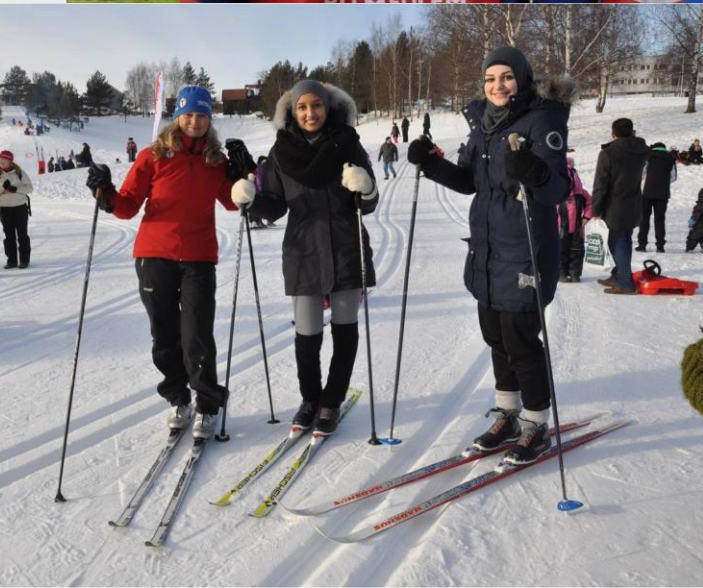
Furuset IF / Alnaskolen 02.03.17