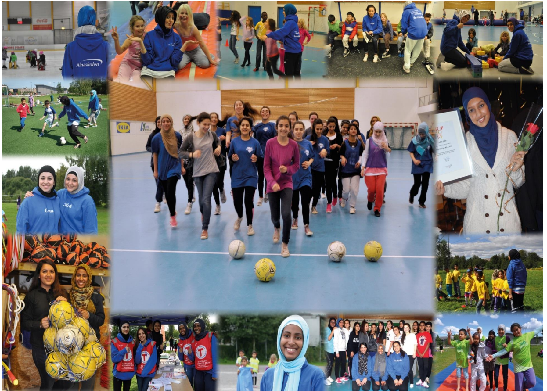
Furuset IF / Alnaskolen 02.03.17