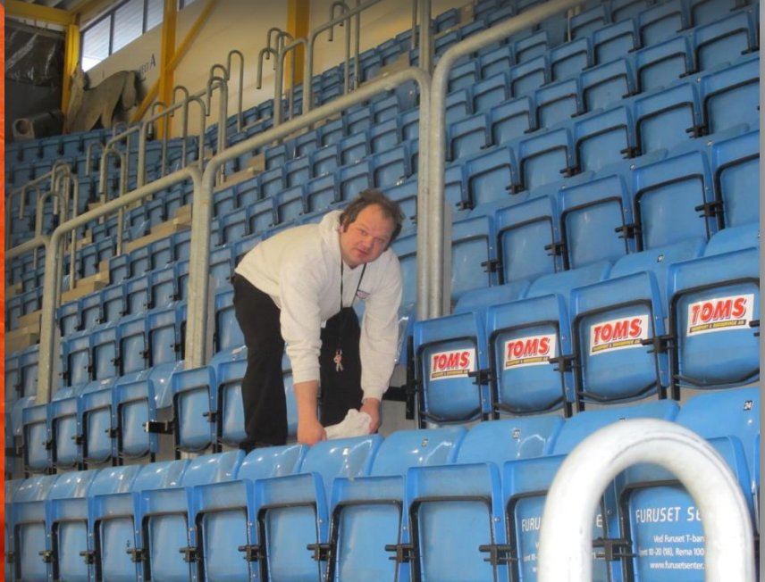
Furuset IF / Alnaskolen 02.03.17