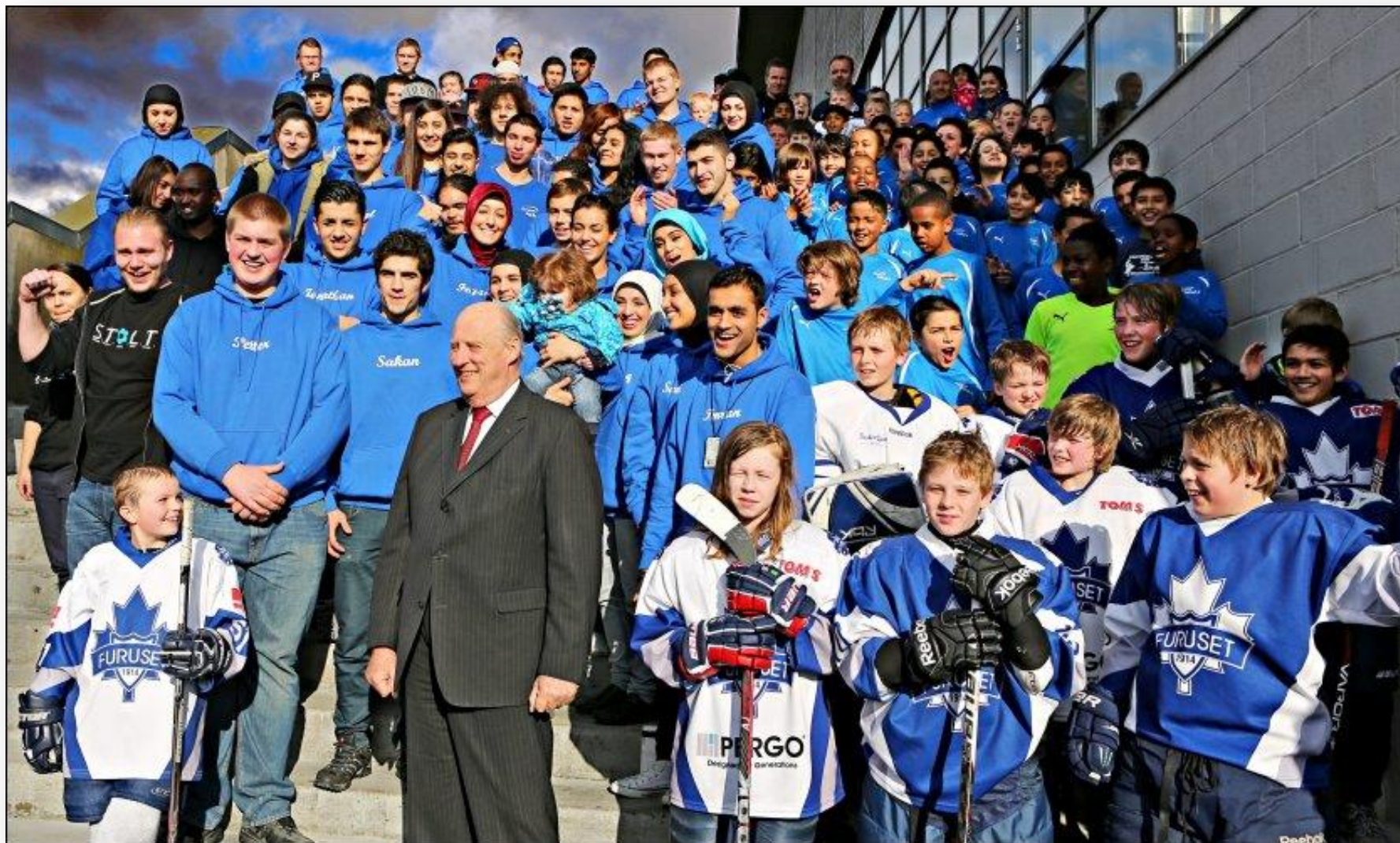
Furuset IF / Alnaskolen 02.03.17