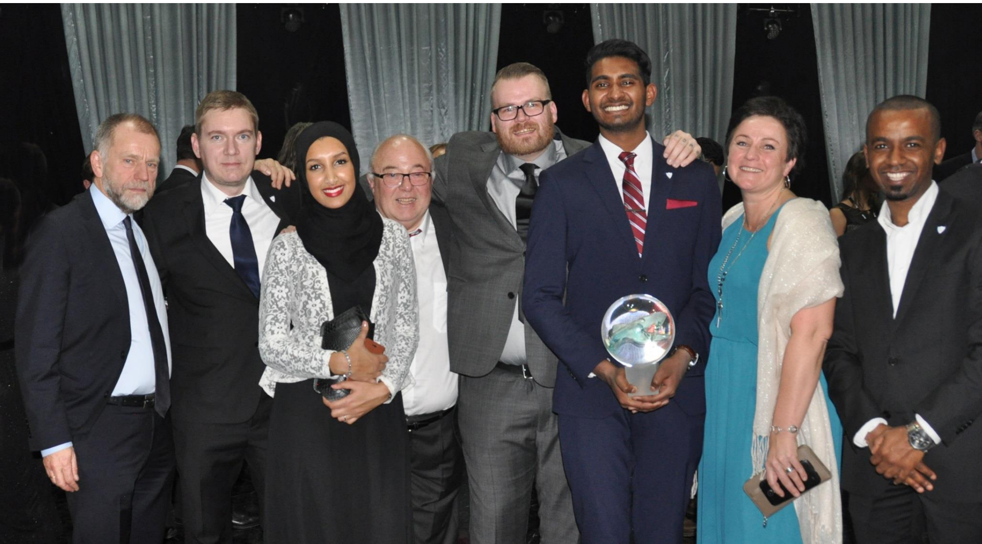
Furuset IF / Alnaskolen 02.03.17