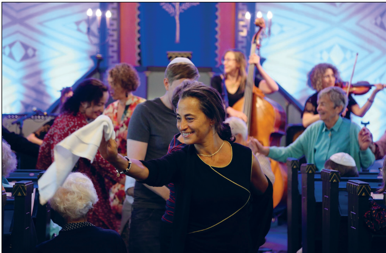
Figur 4.4 Fra den jødiske kulturfestivalen i Trondheim