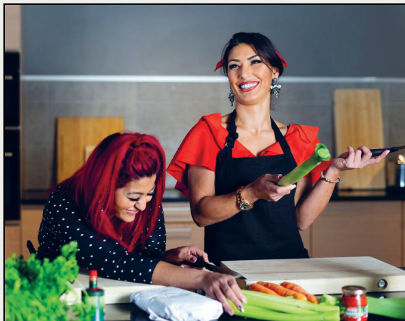
Figur 4.1 Fra Chabatane Romane – romsk kokeprogram

Jødisk kulturfestival i Trondheim fikk tilskudd til prosjektet Tjuvstart og til en familieforestilling under festivalen. Prosjektet gjaldt to arrangementer, et sabbatsmåltid med musikk-innslag og fortellinger, og en teaterforestilling som bygger på bibelhistorien om dronning Esther. Den jødiske kulturfestivalen i Trondheim har vært arrangert årlig siden 2010 og formidler jødisk kultur til et allment norsk publikum.