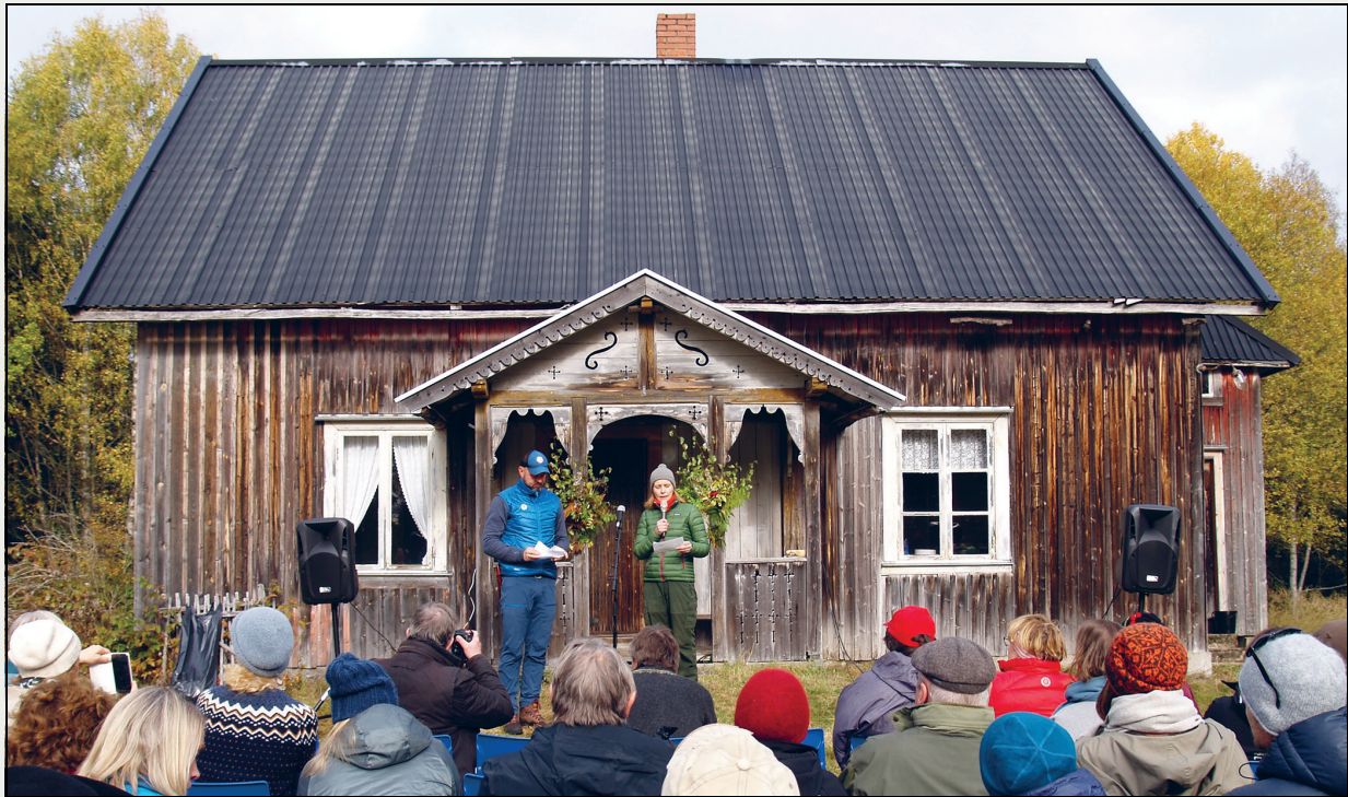
Figur 4.3 Fra et arrangement i forbindelse med fredningen av Abborhøgda