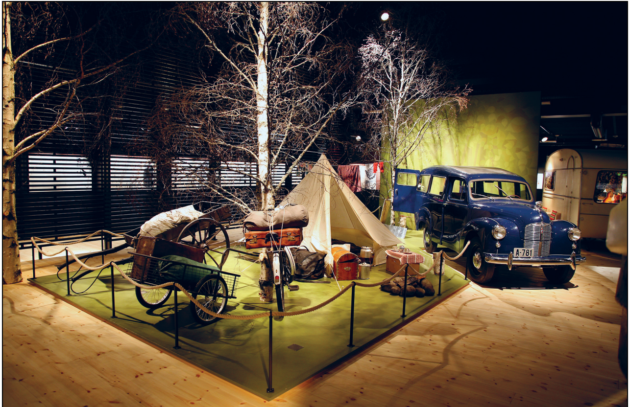
Figur 3.1 Leirplass, del av utstillingen Latjo drom