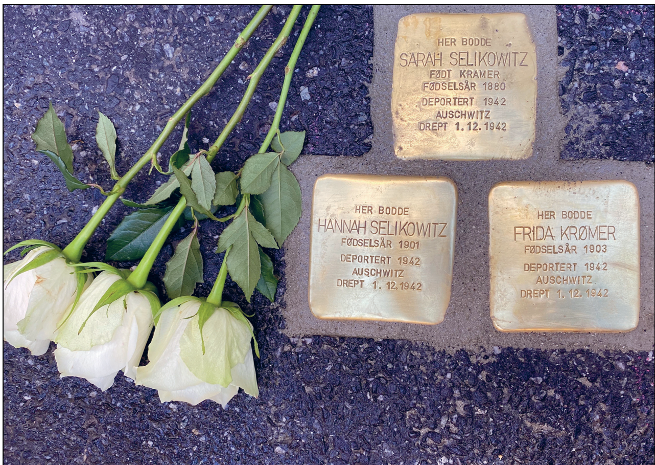
Figur 5.1 Snublesteiner ved St. Hanshaugen i Oslo

Offisielle minnesteder etter kriger, katastrofer eller terrorangrep, fungerer som konkrete steder å gå til for å minnes og bearbeide fortiden, både for direkte berørte og den øvrige befolkningen. Det er få offisielle minnesteder som gjelder de nasjonale minoritetene i Norge. Ved Akershuskaia ble det satt opp et minnesmerke i 2000 over jøder som ble deportert under andre verdenskrig.