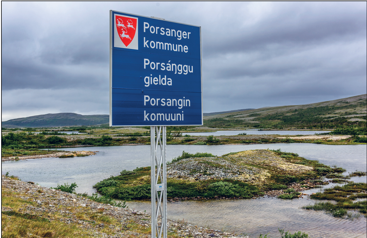
Figur 4.2 Trespråklig skilting i Porsanger