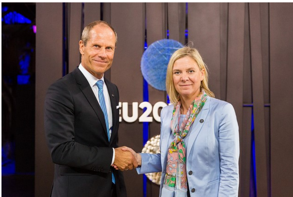
Finansminister Tõniste (Estland) og finansminister Andersson (Sverige)

Finansministrene drøftet også hvordan EU-budsjettet bedre kunne bidra til å dekke til å klargjøre land for euromedlemskap. I denne forbindelse ble muligheten for å styrke kondisjonaliteten ved utbetalingen av strukturfondsmidler trukket frem. Kommisjonen ble bedt om å komme med forslag til oppfølging.