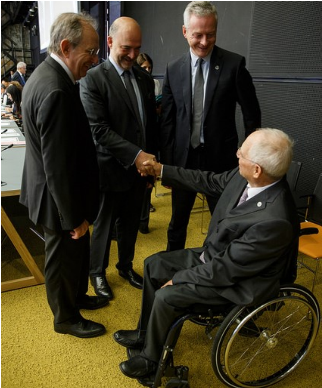
Schäuble (Tyskland) hilser på Moscovici (Kommisjonen), Padoan (Italia) og Le Maire (Frankrike).

Etter finanskrisen er det gjennomført tiltak på en rekke områder for å styrke motstandskraften, som etableringen av en felles krisefinansieringsmekanisme, arbeidet med bankunionen (som skal stå ferdig i 2024), kapitalmarkedsunionen (som skal være ferdig i 2019) og strukturreformer på en rekke områder.