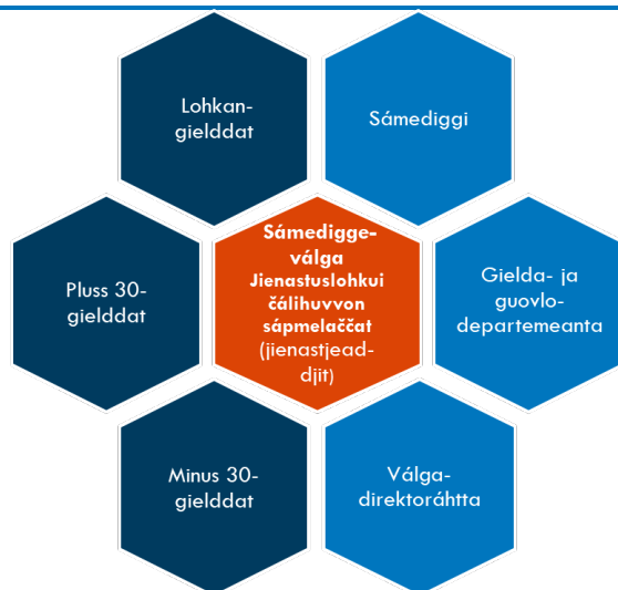
Figuvra 2-2: Oassálasti aktevrrat