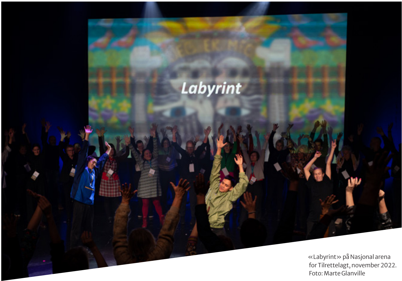
«Labyrint» på Nasjonal arena for Tilrettelagt, november 2022.