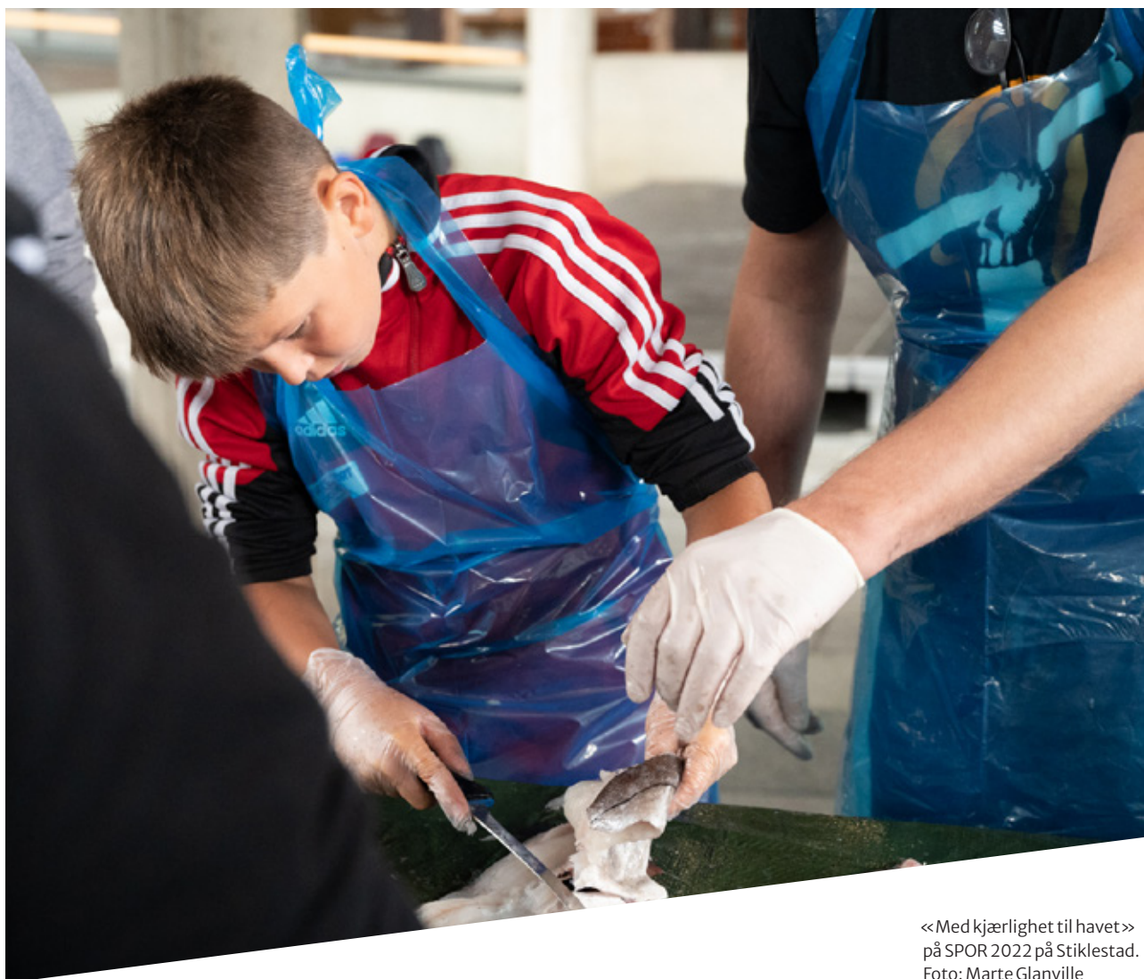
<< Med kjærlighet til havet >> på SPOR 2022 på Stiklestad.

Kulturtanken har oppdatert sin beredskapsplan i forbindelse med gjennomføring av beredskapsøvelse. Etatens risikovurderinger har også blitt oppdatert i denne sammenhengen. Det har i 2022 blitt gjennomført brannøvelse i regi av huseier, og det er avholdt obligatorisk førstehjelps- og hjertestarterkurs for alle medarbeidere.