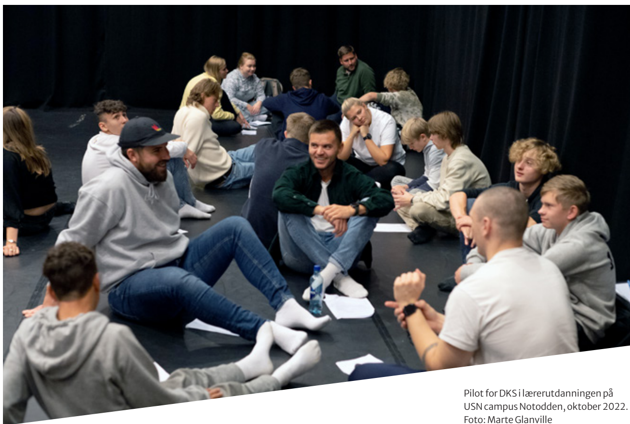
Pilot for DKS i lærerutdanningen på USN campus Notodden, oktober 2022.

Det er arbeidet videre med kulturkontaktrollen, som bidrar til samhandling mellom sektorene og forbedringer i kvalitetskjeden. Arbeidet i ressursgruppen for kulturkontakter ble videreført våren 2022. I samarbeid med kulturkontakter fra videregående skoler og grunnskoler fra DKS i Agder og Viken ble erfaringene og kunnskapsgrunnlaget samlet. Målet for ressursgruppen var å synliggjøre og styrke kulturkontaktrollen. Av resultatet av dette samarbeidet ble det prioritert å utvikle en egen veileder for kulturkontaktene i DKS-ordningen. Veileder for kulturkontakter ble publisert høsten 2022 og inneholder praktiske eksempler på blant annet attester til kulturverter, forslag til hvordan DKS-besøkene kan inngå i skolens årshjul, anbefalinger omkring elevmedvirkning, bruk av DKS-portalen og eksempler på informasjonsarbeid i forbindelse med skolens DKS-arrangementer. På denne måten synliggjør veilederen hvordan man kan forenkle samarbeidet mellom rektor, kulturkontakten, læreren og elevene på den enkelte skole.