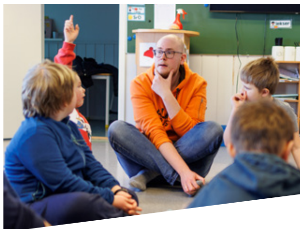
«Kunsten å lære» på Aurvoll skole i Øyer kommune, februar 2022.

Vi sender ut nyhetsbrev en gang i uken. Nyhetsbrevet har over 3 200 abonnenter.