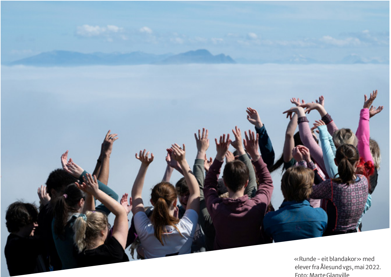
<<Runde – eit blandakor>> med elever fra Ålesund vgs, mai 2022.