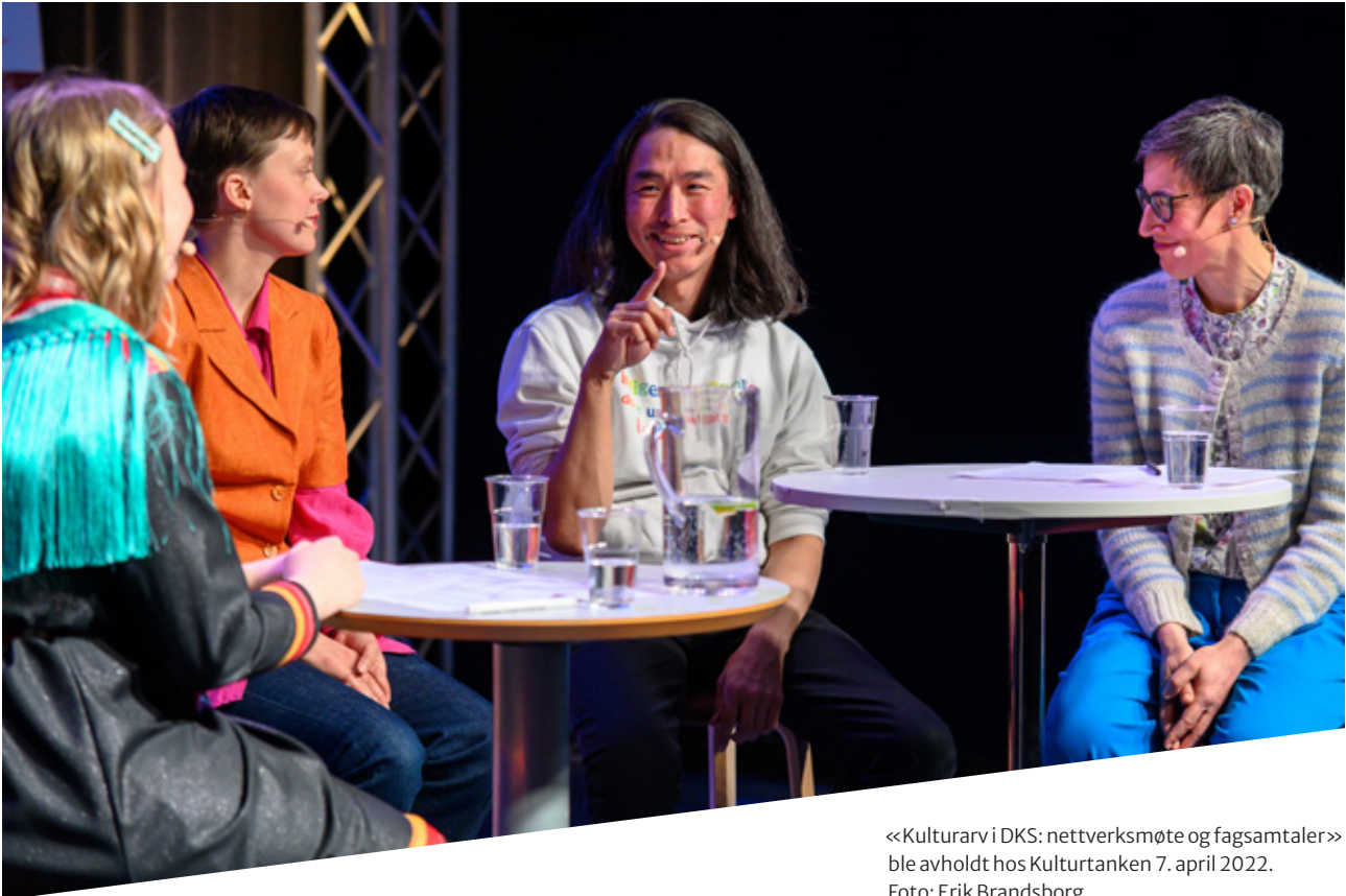
<<Kulturarv i DKS: nettverksmøte og fagsamtaler>> ble avholdt hos Kulturtanken 7. april 2022.

sammen. Hvert år er et nytt tema i sentrum. Den 13. og 14. september var temaet «kystkultur». Kystkultur ble trukket frem i museumsmeldingen (Meld. St. 23 (2020–2021)) som ett av to viktige satsingsområder. Derfor undersøkte denne utgaven av SPOR akkurat dette temaet. Kystkultur inneholder mye. Det har en tidsdybde fra steinalderens bosettinger via nasjonsbygging til dagens havbruk. Den viktigste transportveien har vært sjøen, og varer, historier og ideer fra fjerne land har funnet veien til den innerste fjord. Havet har brakt folk ut i verden, og verden til oss, og skapt forbindelseslinjer. Livsformen på kysten har gjort at mennesker har endret landskapet der, og kystfolket har dratt på sjøen med livet som innsats. Under SPOR 2022 stilte vi oss spørsmål som: Hva forteller vi barn og unge om kystkultur i dag, og på hvilke måter er kystkulturen relevant for dagens unge? Hva med den problematiske kystkulturarven som for eksempel den skandinaviske slavehistorien – hvordan formidler vi den? Og hvordan revitaliserer vi den glemte kystarven? Gjennom foredrag, filmvisninger, fortellinger, pitchkonkurranse og produksjoner fikk vi belyst flere innganger til hva kystkultur kan være, og hva slags betydning den fortsatt kan ha.