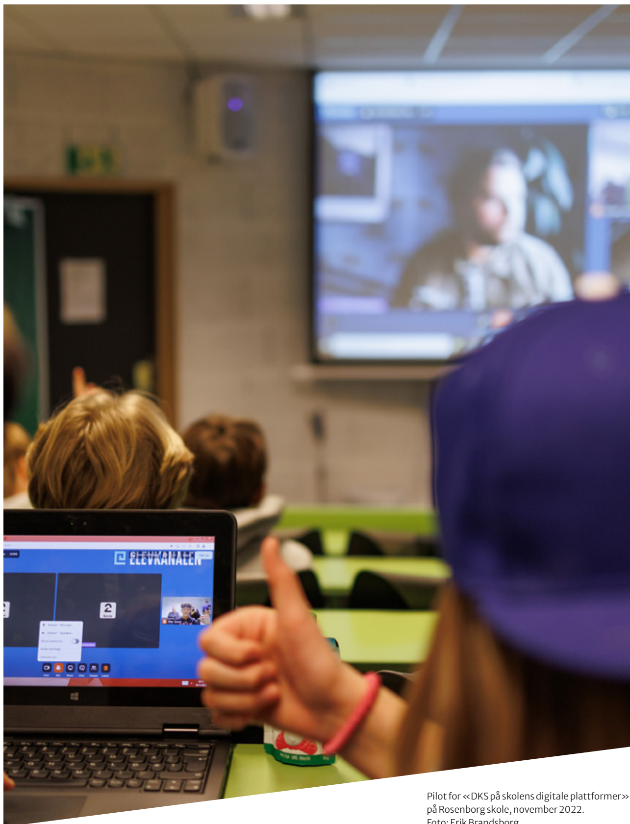
Pilot for «DKS på skolens digitale plattformer» på Rosenberg skole, november 2022.