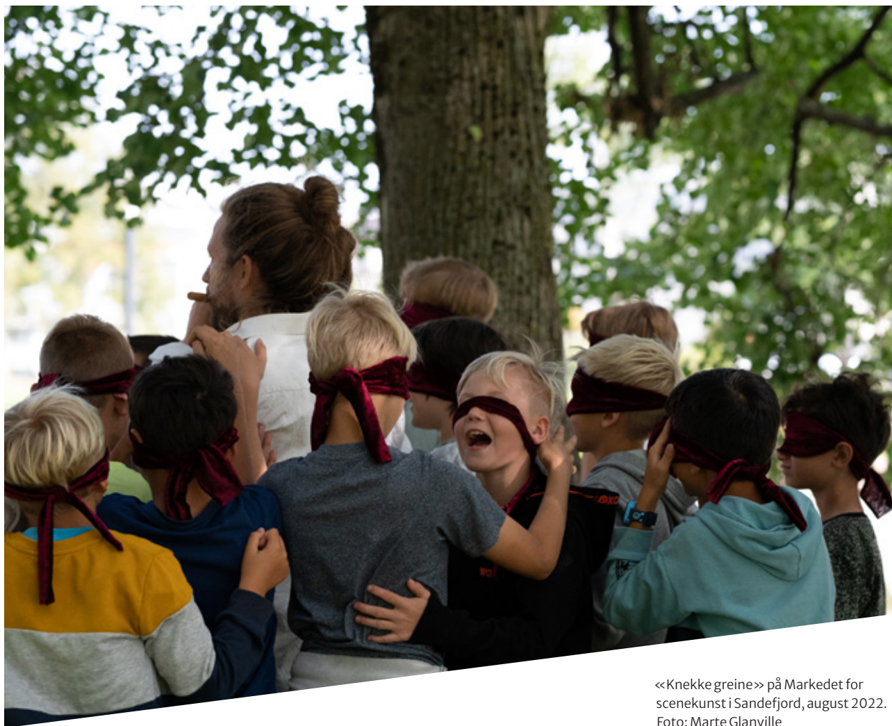
«Knekke greine» på Markedet for scenekunst i Sandefjord, august 2022.

YAM (Young Audiences Music) er verdens største nettverk for musikk for barn og unge med over 70 land representert. Kulturtanken sitter i rådet for YAMsession og YAMawards, som arrangerer internasjonale visninger, prisutdelinger, seminarer og konferanser. I 2022 ble YAMsession arrangert 17.–19. oktober i Brugge, Belgia. Kulturtanken inviterer musikknettverket i DKS til YAMsession hvert år for erfarings- og kunnskapsdeling.