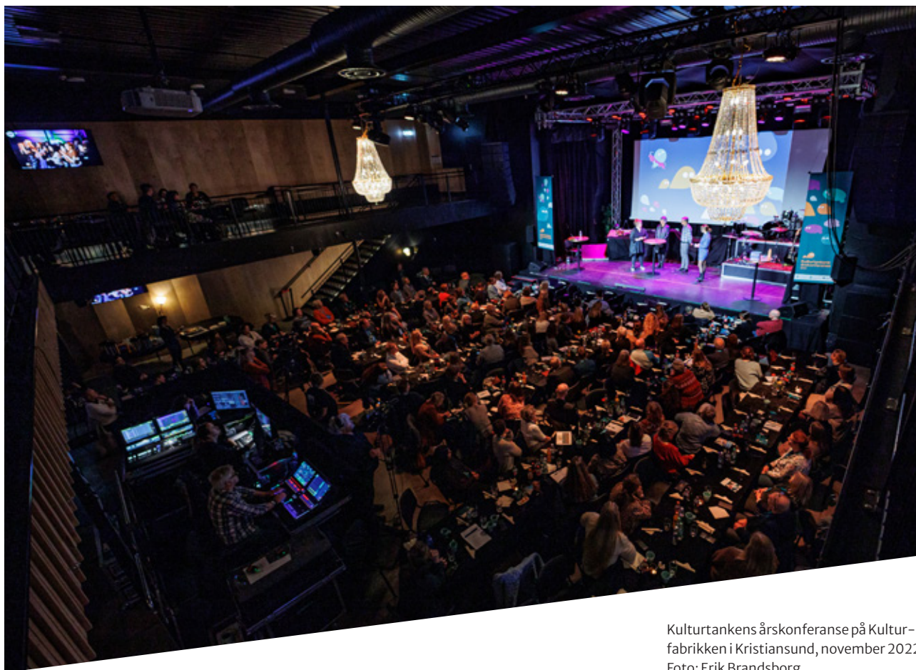
Kulturtankens årskonferanse på Kulturfabrikken i Kristiansund, november 2022.