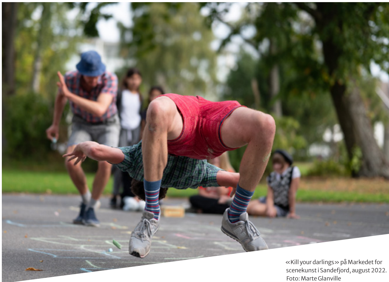
«Kill your darlings» på Markedet for scenekunst i Sandefjord, august 2022.

Fremover er det ønskelig med ytterligere styrkning innen målområdet. Flere av de etablerte samarbeidene om å få DKS inn i lærerutdanningene har karakter av pilotprosjekt. Fortsatt ressurstilflytning kan bidra til å etablere DKS som en fast del av alle lærerutdanninger. Samarbeidet med UH-sektoren er god. Samtidig retter sektoren seg etter prosjekt med nødvendig ekstern finansiering. Videre styrking av samarbeid med sektoren forutsetter derfor tilstrekkelig ressursavsetning.