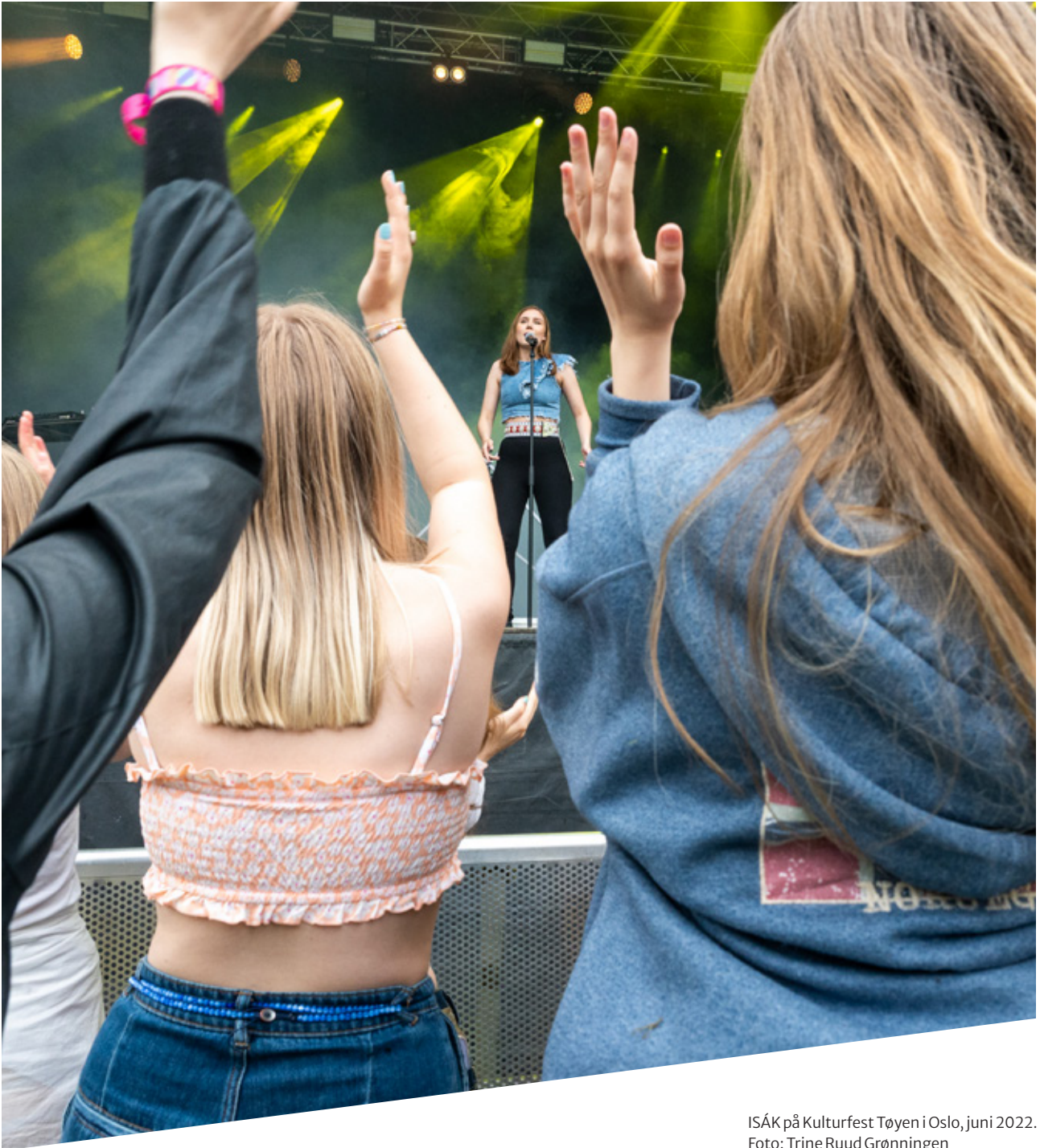
ISÁK på Kulturfest Tøyen i Oslo, juni 2022.

Gjennom tiltak som ny nasjonal arena for barn og unge med funksjonsvariasjoner, utvikling av veileder for filmvisning i DKS, kritikkseminar med ungdommer, DKS litteratur-lab og prosjektet Meir nynorsk i DKS er mangfoldet i ordningen styrket og det er kommet til viktige tilbud som er åpne og inkluderende.