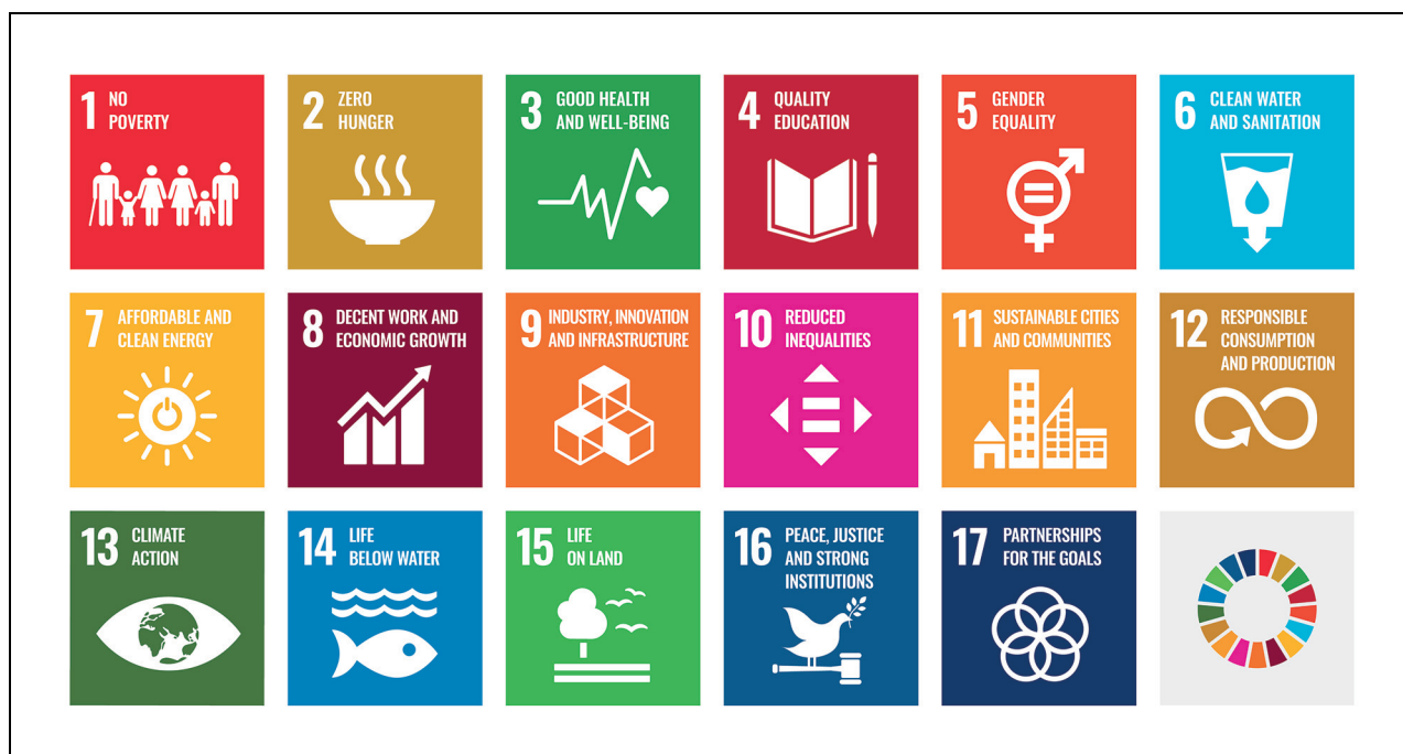
Figur 10.1 FNs bærekraftsmål

Klima- og miljødepartementet ivaretar helheten i regjeringens klima- og miljøpolitikk, og forsvarssektorens klima- og miljøarbeid er derfor gitt en særskilt presentasjon i Klima- og miljødepartementets budsjettproposisjon. Basert på anmodning fra Kommunal- og distriktsdepartementet rapporteres sektorens arbeid i det følgende etter strukturen for FNs bærekraftsmål.