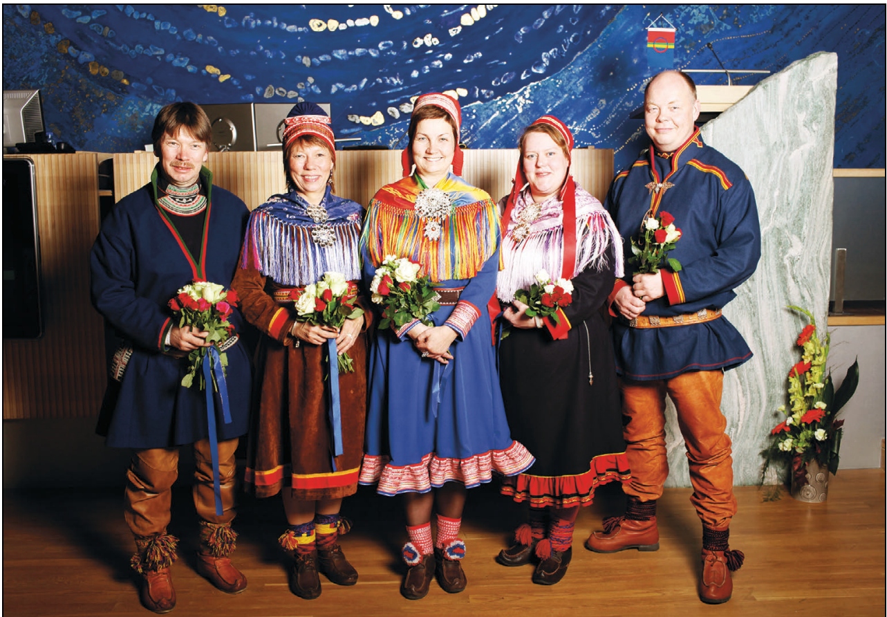
Figur 1.2 Sametingsrådet

Plenums møtene har vært tolket av fire faste tolker fra/til norsk (svensk), nordsamisk, lulesamisk og sørsamisk, alt etter hvilket språk som ble brukt fra talerstolen.