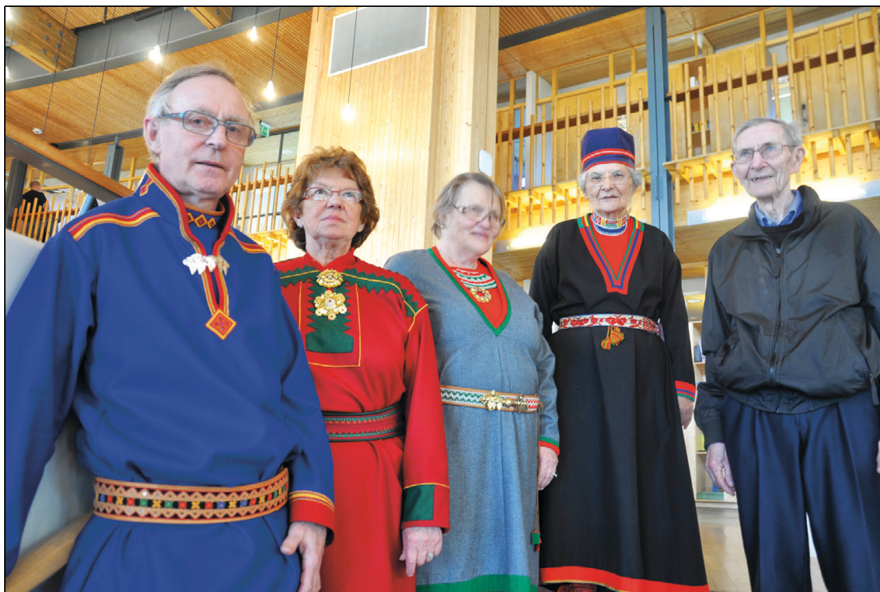
Figur 1.7 Sametingets eldreråd

Sametingets klagenemnd for tilskuddssaker, som Sametinget opprettet i 2011, skal ivareta rettsik-