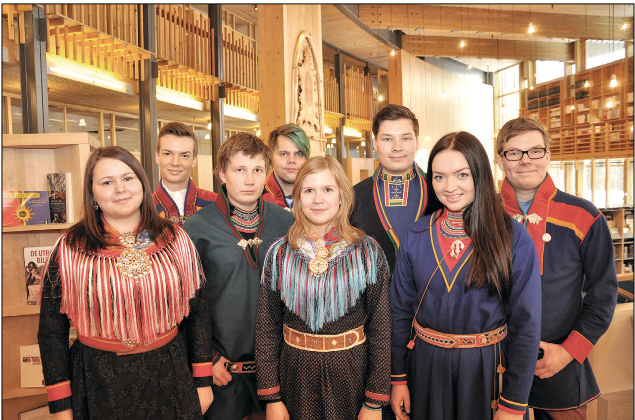
Figur 1.6 Sametingets ungdomspolitiske utvalg for perioden 2014–2015