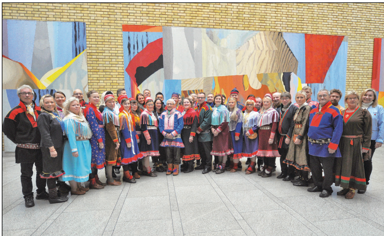
Figur 1.5 Sametingets representanter og sametingsrådet under plenums møtet i Stortinget i september 2015