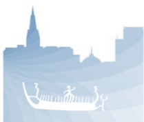
Kulturminner og kulturmiljø