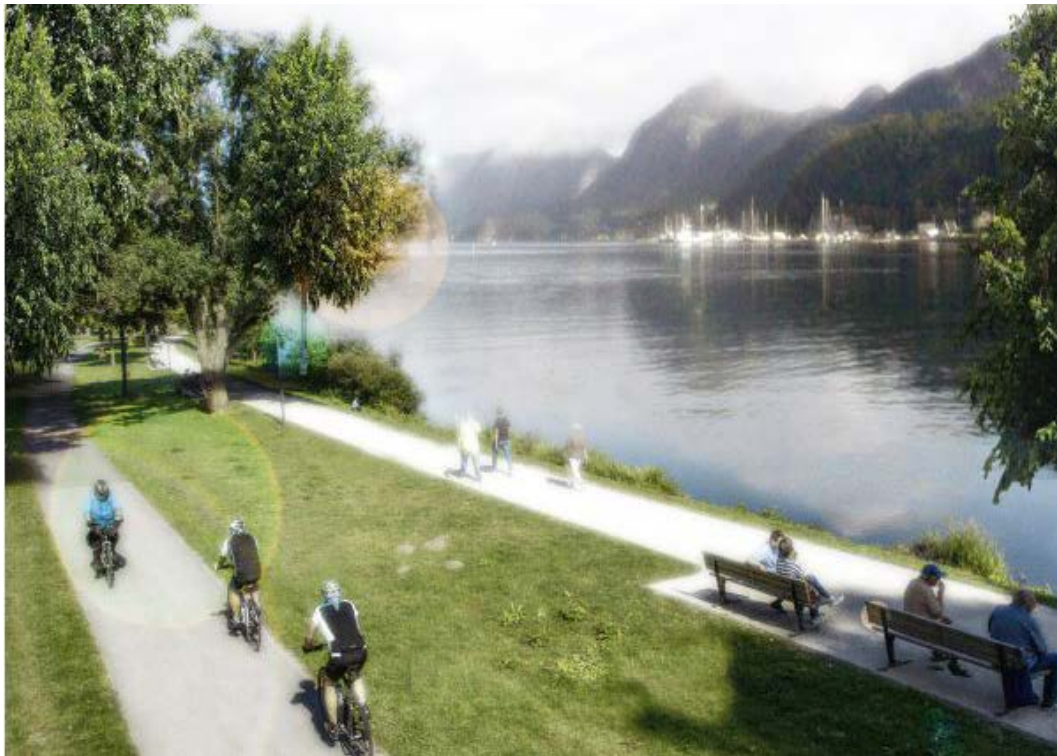
Illustrasjon, Gandsfjorden og syklistier