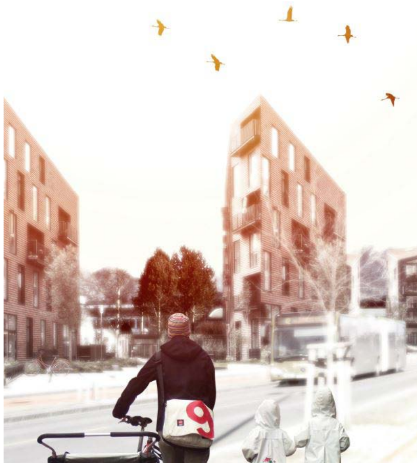
Illustrasjon, buss og tett bebyggelse i prioritert byutviklingsakse

Innsats for å bedre kollektivtilgjengeligheten til alle deler av kommunen er innarbeidet i kommuneplanens samfunnsdel. I tillegg blir disse innspillene videreformidlet fra Sandnes kommune i møter med Kolumbus.