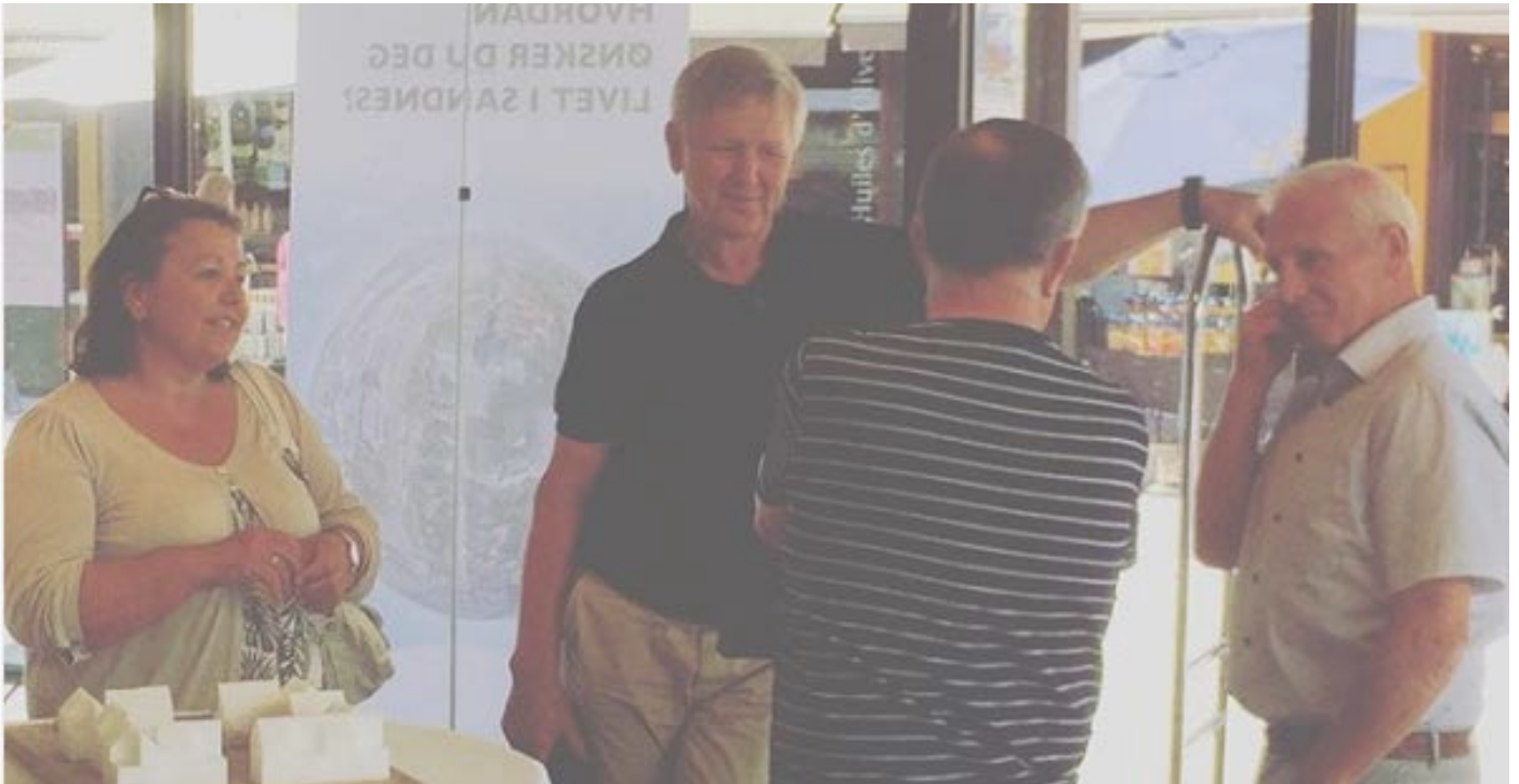
Foto, diskusjon på høringskontoret

Medvirkning og innbyggerinvolvering er viktig i all kommunal planlegging. Planene lages for og påvirker innbyggernes liv. Innbyggernes mening om utviklingen i egen kommune er viktig for rådmannen som lager planene og politikerne som skal vedta planene til slutt.