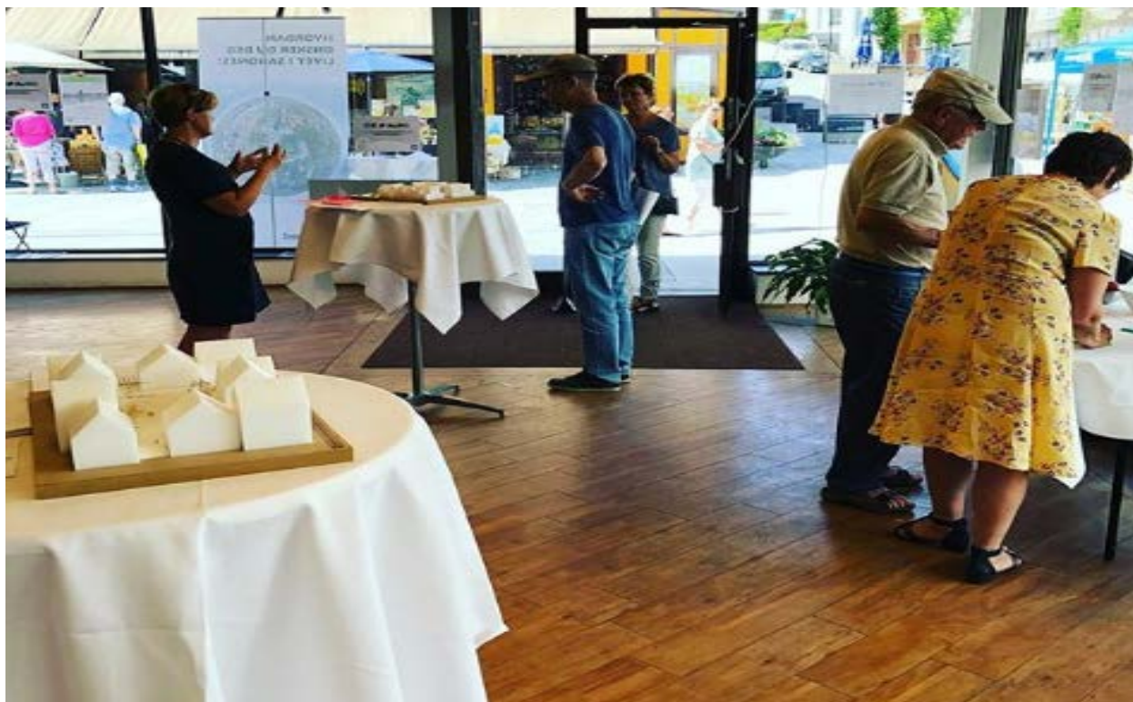
Foto, besøkende og møblering med modeller på høringskontoret i Langgata

I tillegg benyttet kommunen en rekke illustrasjoner som viste mulige utviklingsgrep i de sentrale delene av kommunen som drøftingsgrunnlag. I tillegg inneholdt ble besøkende tilbudt å kommenter og ta med seg det offisielle kommuneplankartet, temakart og aktuelle dokumenter.