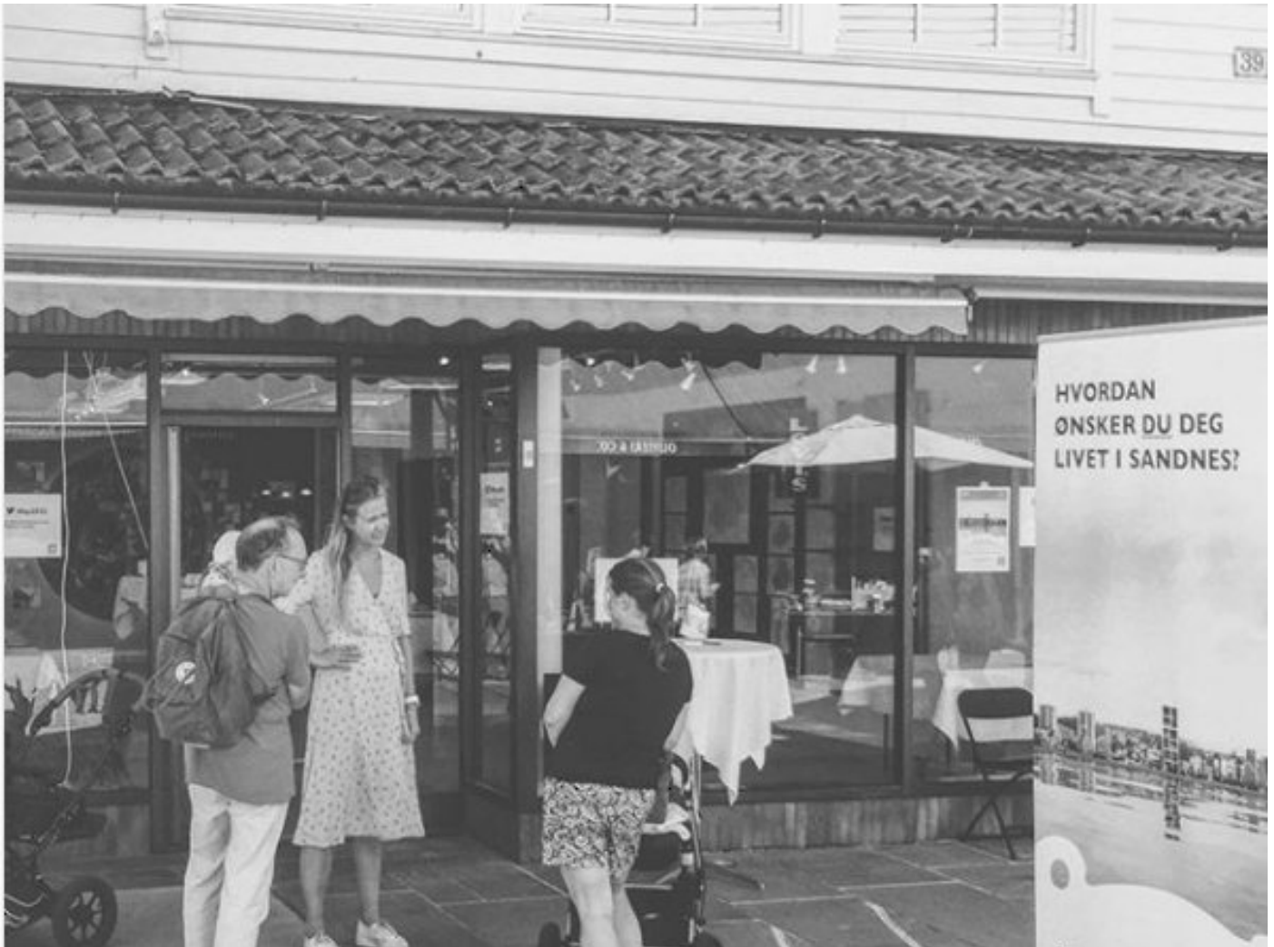
Foto, møte utenfor høringskontoret

Som en del av høringen av forslaget til ny kommuneplan hadde kommunen et midlertidig høringskontor i Langgata 39 i perioden 4. – 15. juni 2018. Dette sammenfalt delvis med «Sandnesugå» og det var mer folk og liv i byen enn vanlig.