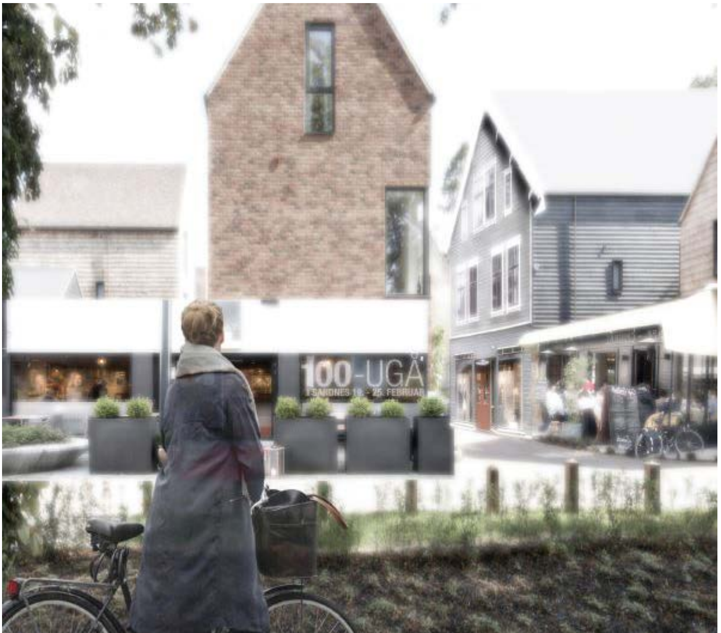
Illustrasjon, Langgata og ny bebyggelse i tegl

I forslag til handlingsdel foreslås det at plassering av ny svømmehall Ganddal- Sandved- Sentrum-Lura, utredes og avklares frem til neste kommuneplanrevisjon. Her har rådmannen supplert tekst om å utforske mulighet for svømmehall basert på innspillene i høringskontoret.