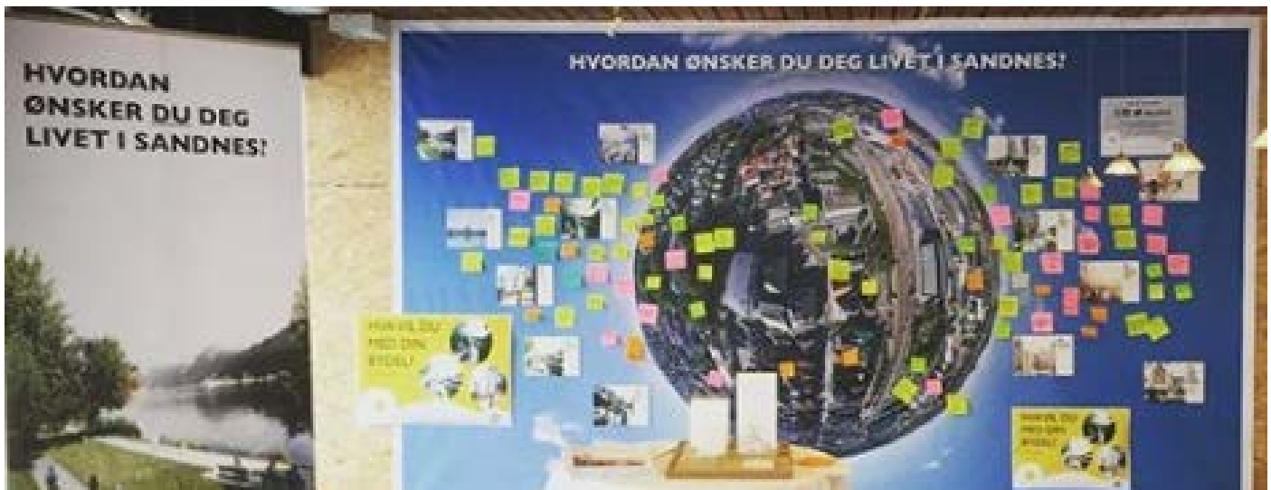
Illustrasjon, høringskontoret og endevegg med noen av forslagene fra besøkende mellom 4.-15.6.18