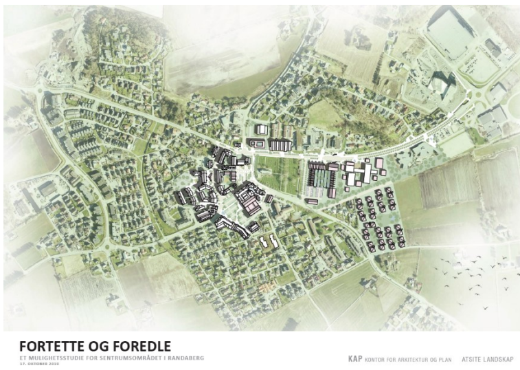
«Fortette og foredle» fra KAP Kontor for Arkitektur og Plan i samarbeid med Atsite Landskap

Det ble ikke kåret en vinner, men begge studiers analyser og anbefalinger skal danne en viktig del av kunnskapsgrunnlaget for arbeidet med kommunedelplan for Randaberg sentrum.