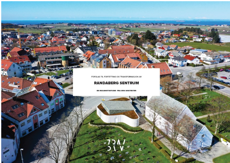
«Forslag til fortetting og transformasjon av Randaberg Sentrum» fra 3RW Arkitekter

aldersvennlig, på å definere og avgrense landsbyens offentlige steder og uteområder mye tydeligere, og på å tilrettelegge for midlertidig bruk av fraflyttede (offentlige) bygg før tomtene skal få ny permanent bruk, istedenfor å rive dem og skape tomme steder eller parkeringsarealer.