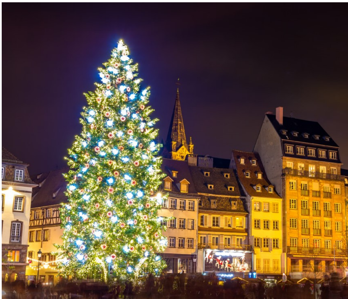
Juleidyll fra Strasbourg.