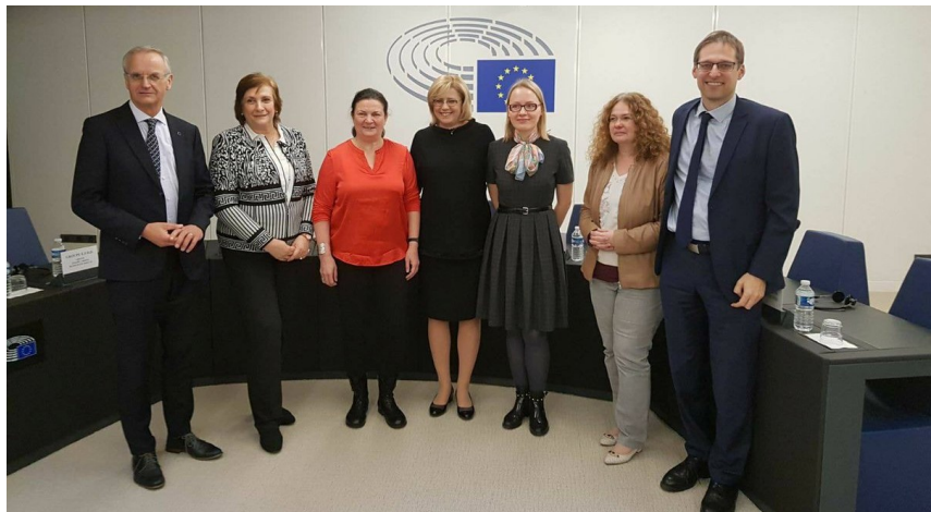
Fra venstre til høyre: Europaparlamentarikere, Europakommisjonen og det estiske presidentskapet smiler fornøyd etter fullførte forhandlinger om revisjonen av fellesregelverket for EUs strukturfond («omnibus»).

Et aktuelt eksempel er den sjettede runden med trilogforhandlinger om revidert avfallsregelverk den 17 desember 2017. Avfallsregelverket er en del av EUs pakke om sirkulær økonomi. Etter 18 timer med forhandlinger lykkes Europaparlamentet, medlemslandene i Rådet og Europakommisjonen å komme frem til en foreløpig avtale. Den foreløpige avtalen må godkjennes av Rådet og Europaparlamentet før endelig regelverk publiseres. Det er ventet at dette vil skje relativt tidlig i 2018.