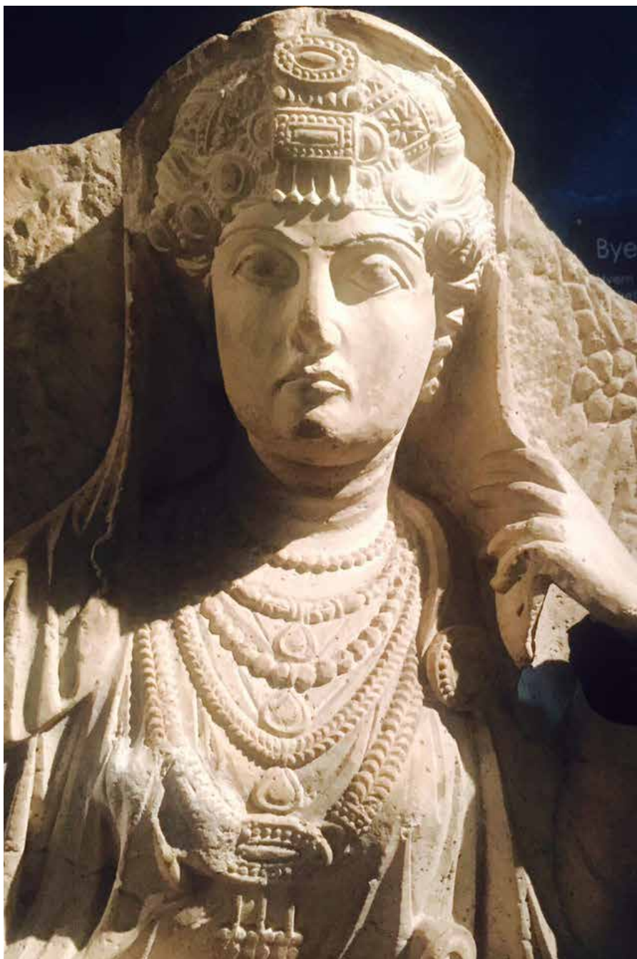
Byste fra Palmyra utstilt på Kulturhistorisk museum i Oslo.