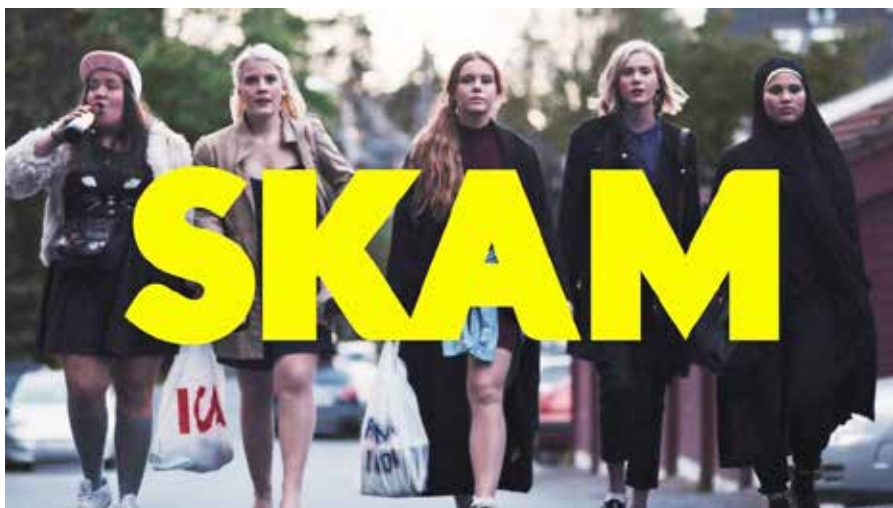
Ungdomsserien «SKAM» som fikk Nordens språkpris 2016.