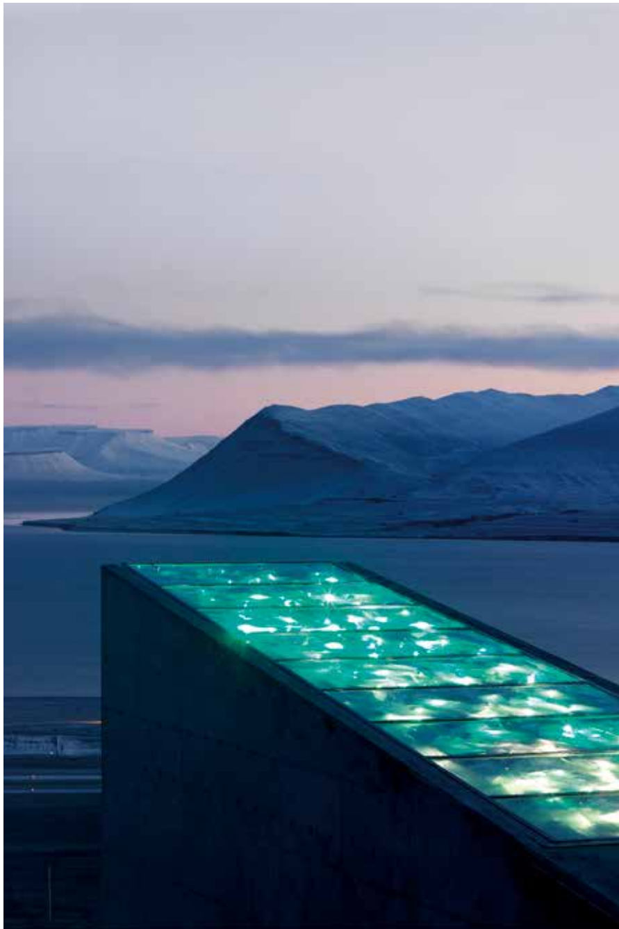
Svalbard globale frøhvelv, med glitrende fasade designet av kunstneren Dyveke Sanne.

Norge vil løfte disse temaene under et arktisk kulturtoppmøte – Arctic Arts Summit – i Harstad, 21. og 22. juni.