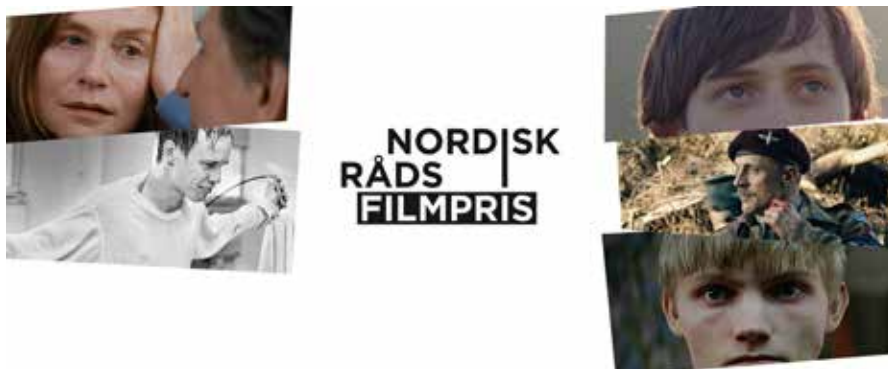
De nominerte til Nordisk råds filmpris 2016.

Det vil bli arrangert et filmpolitisk ministerseminar om denne tematikken under Filmfestivalen i Haugesund, 21. august 2017.