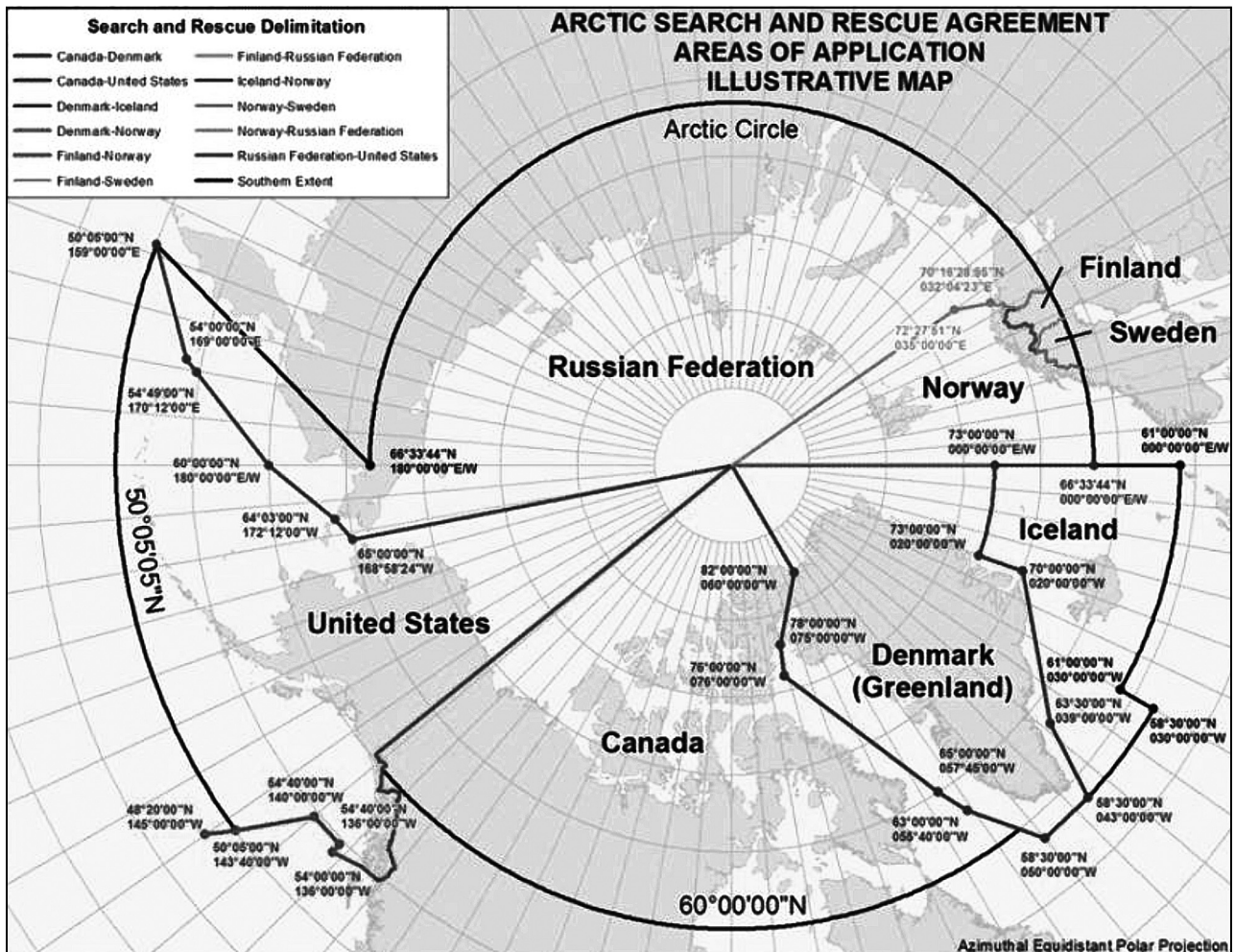
Figur 2.1 Ansvarsområde for søk- og redning i Arktis

Det styrkte redningssamarbeidet er viktig for optimal utnytting av dei ressursane som finst i regionen og for å komme naudlidande til unnsetning så raskt som mogleg. For å styrkje arbeidet med søk og redning på Svalbard og i nærliggande havområde, har Stortinget etter forslag frå Regjeringa vedteke at Sysselmannen frå 2014 skal ha to store likeverdige helikopter. Det er inngått kontrakt med Lufttransport AS om leige av to Super Puma helikopter med avansert utstyr. Bakgrunnen for dette er både det utvida ansvarsområdet som følger av avtala nemnd over, og den auka betydninga Longyearbyen vil få som base for rednings- og forureiningsberedskap i dei nordlege havområda. Dette vil styrkje redningsberedskapen på fleire måtar. Helikoptra har auka rekkevidde og vil kunne plukke opp 18 naudstilte innafør ein radius på 120 nautiske mil. Vidare har helikoptra større lasteevne, nytt moderne søkeutstyr og betre kommunikasjons- og sikkerheitsutstyr. I tillegg vert uttrykkingstida på reservehelikopteret som no er to timar i kontortida og 12 timar utanom denne,