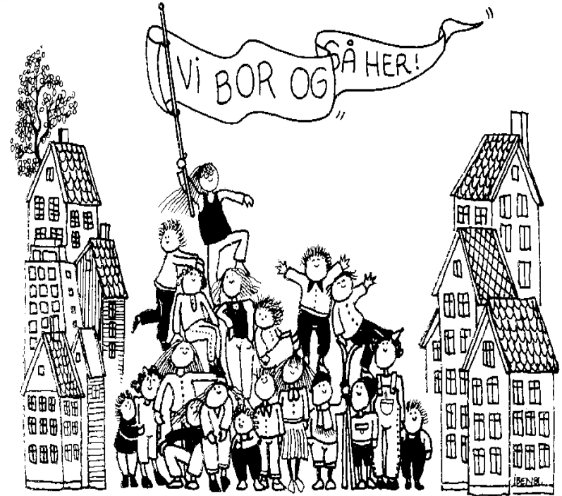
Tegning Iben Sandemose

Pbl gir barn og unge rett til å bli hørt