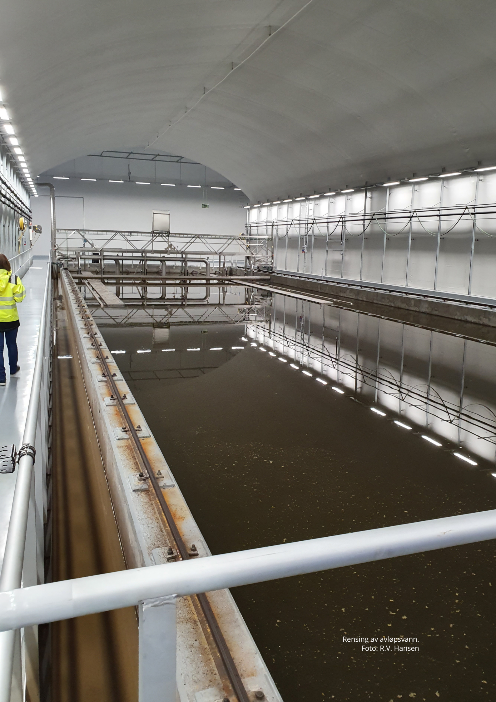
Rensing av avløpsvann.