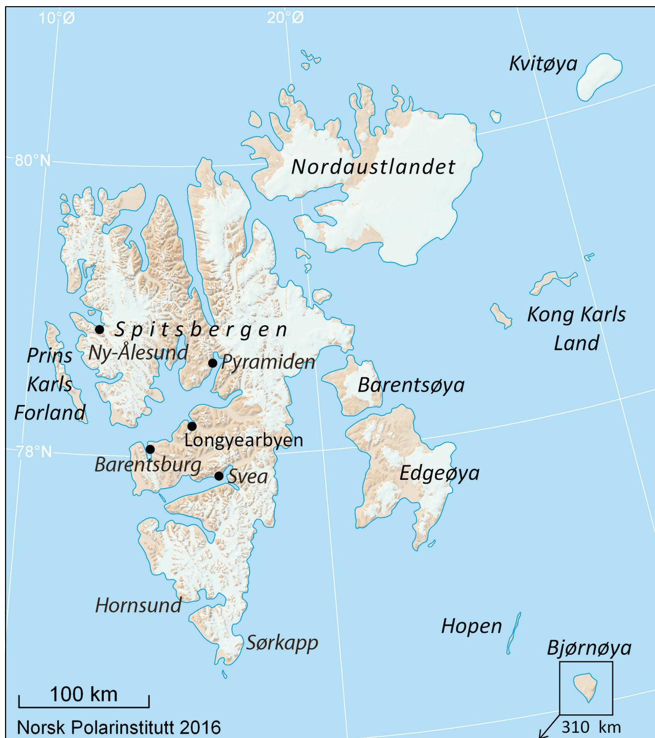
Figur 3.1 Kart over Svalbard